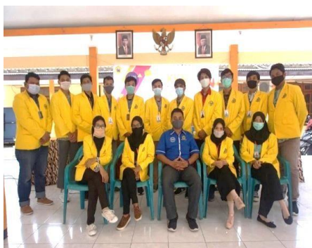
Gambar 2. Foto bersama DPL