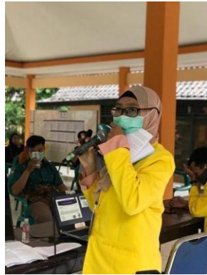
Gambar 6. Sosialisasi E-commerce