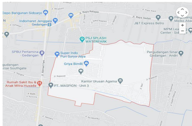
Gambar 1. Peta Desa Punggul

Desa Punggul adalah sebuah desa di wilayah Kecamatan Gedangan, Kabupaten Sidoarjo, Provinsi Jawa Timur. Desa ini berbatasan dengan Desa Ketajen dan Desa Wedi di Utara, Desa Gemuruh di timur, Desa Rebel dan Desa Kragan di selatan serta Desa Seruni di barat.