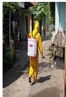
Gambar 17. Penyemprotan disinfektan