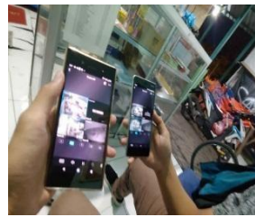
Gambar 15. Pemantauan CCTV dari Handphone