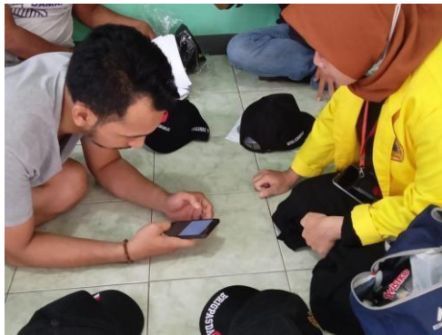
Gambar 8. Praktek penggunaan E-commerce Pada UMKM topi