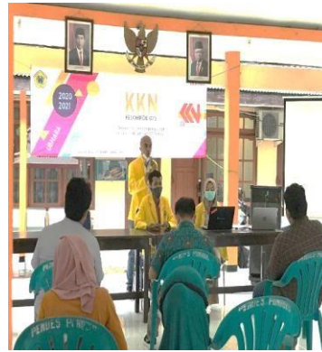
Gambar 7. Sosialisasi E-commerce dari aspek hukum