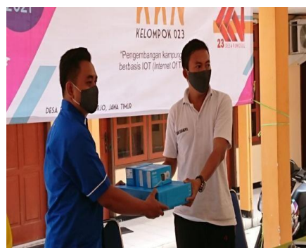
Gambar 3. Penyerahan CCTV sebagai simbolis