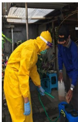
Gambar 16. Pengisian cairan disinfektan