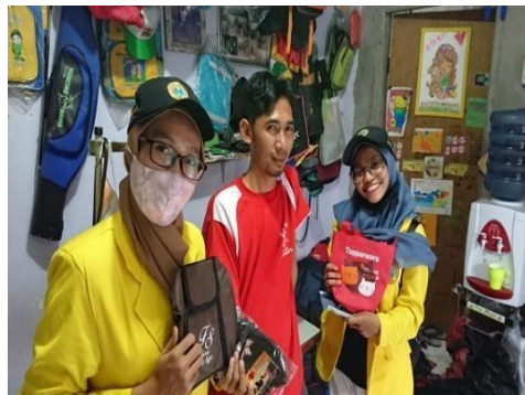
Gambar 5. UMKM Tas Desa Punggul