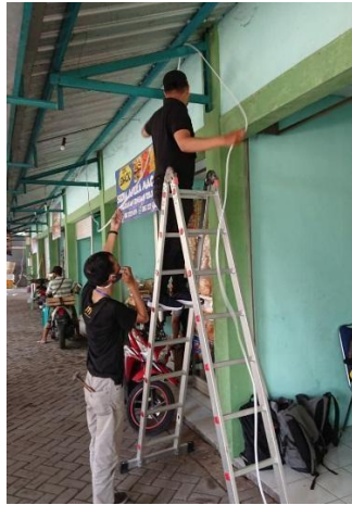
Gambar 12. Penyambungan kabel Untuk pemasangan CCTV