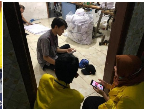
Gambar 9. Praktek penggunaan E-commerce pada UMKM Topidan Tas