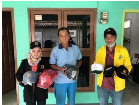
Gambar 4. UMKM Topi Desa Punggul