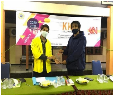
Gambar 10. Penyerahan vendel sebagai Kenang-kenangan