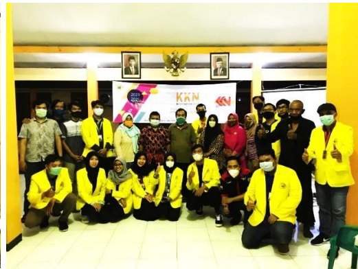
Gambar 11. Penutupan