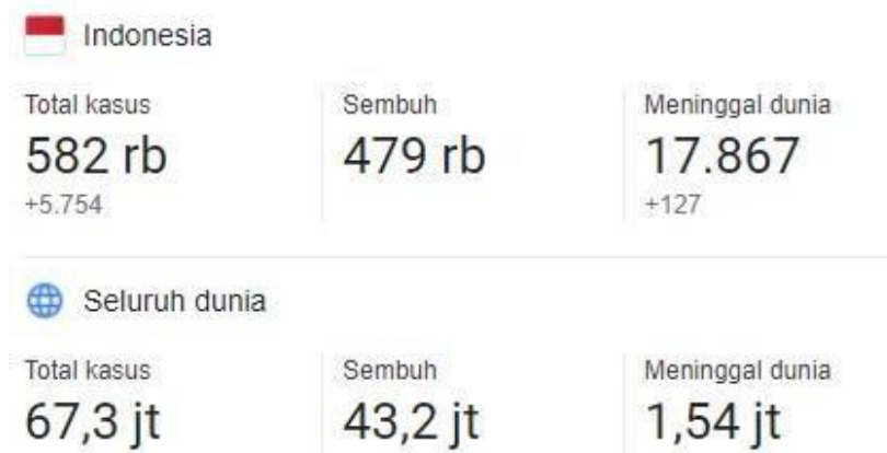
Kasus Corona di Indonesia dan dunia bulan November 2020