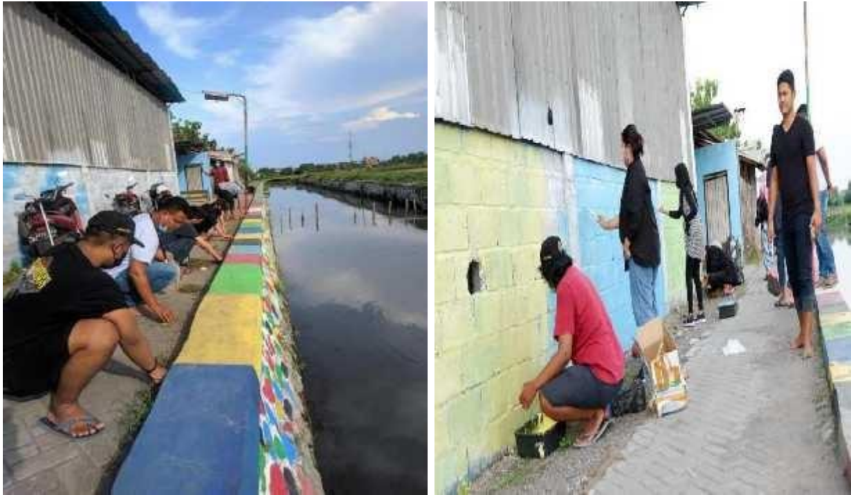
Gambar 1 : Pengecatan Jalan RT.10 Desa Sugihwaras, Kec. Candi, Kab. Sidoarjo