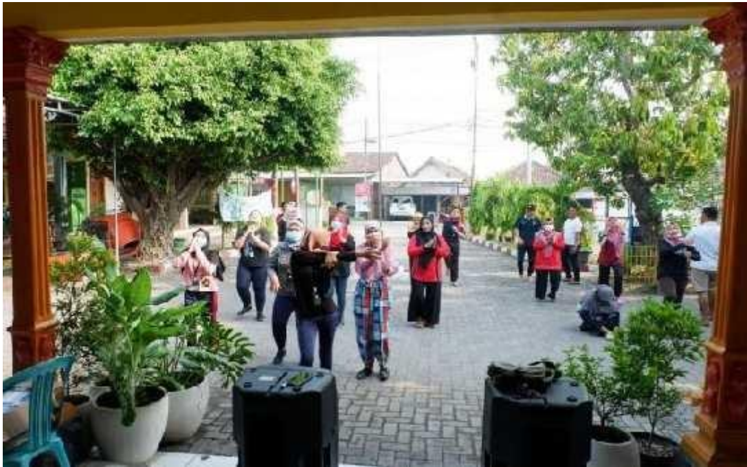
Gambar 6 : Senam Pagi bersama Ibu-ibu PKK