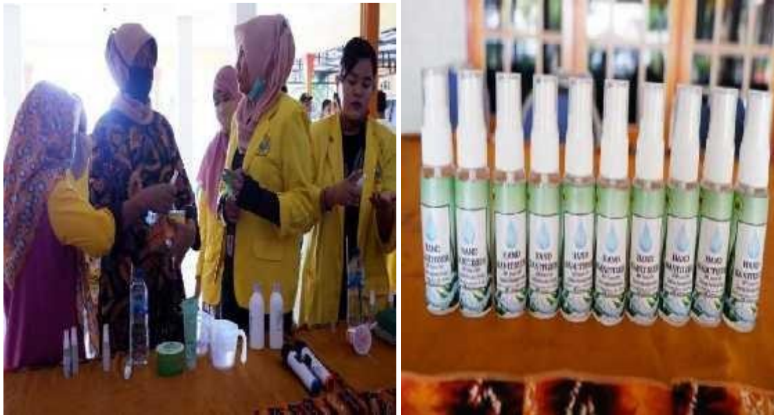
Gambar 5 : Sosialisasi Pembuatan Handsanitizer

Kegiatan ini dilakukan agar masyarakat atau warga desa sugihwaras mengerti cara membuat handsanitizer yang baik dan benar. Hal itu bertujuan agar warga desa sugihwaras bisa membuat handsanitizer di rumah masing masing dengan biaya yang lebih ekonomis. Apalagi dalam situasi pandemic seperti ini handsanitizer sangat sangat dibutuhkan. Handsanitizer selain cara pembuatannya mudah disamping itu juga praktis untuk dibawa kemana mana.