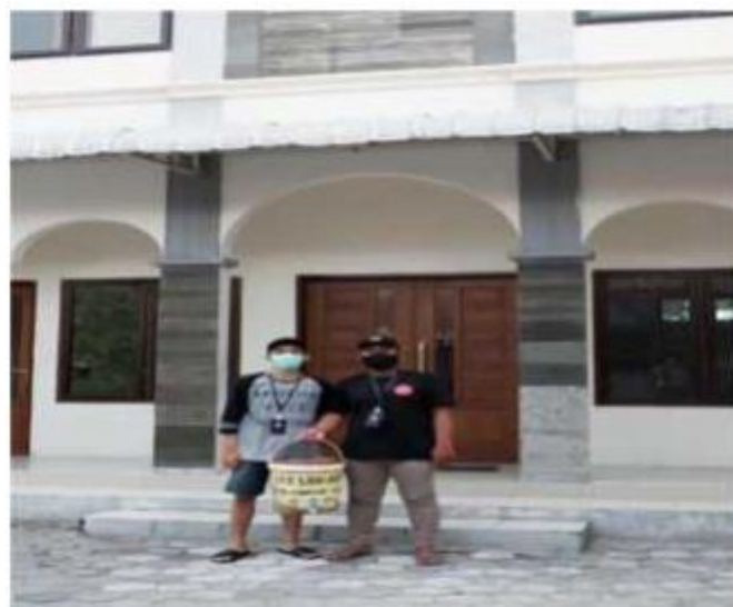
Gambar 3 : Pembuatan Tempat Cuci Tangan

Program kerja yang kami siapkan untuk hal ini adalah program pembuatan tempat cuci tangan untuk setiap rumah warga. Kami juga memberikan lukisan pada tempat cuci tangan tersebut agar lebih menarik untuk di liat. Kami mengharapkan dengan adanya tempat cuci tangan yang sudah kami desain khusus itu menarik warga agar cuci tangan setelah dari tempat keramaian atau sehabis makan.