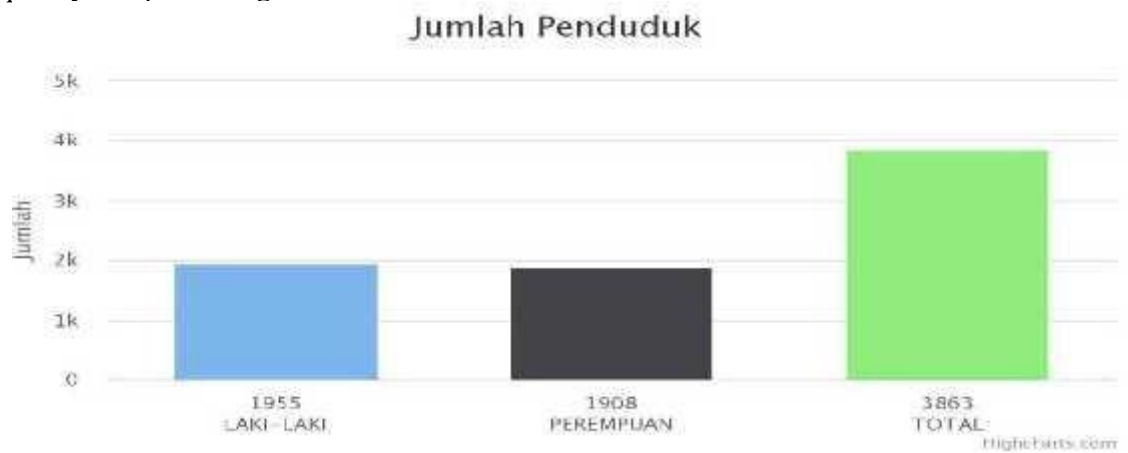
Gambar 1 : Tabel Jumlah Penduduk Desa Sugihwaras, Kec. Candi, Kab. Sidoarjo

Berdasarkan dari hasil data sensus penduduk Desa Sugihwaras ini mempunyai jumlah penduduk yang cukup banyak seperti sebagai berikut ini :