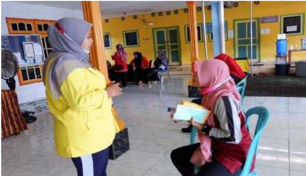
Gambar 7 : Pembagian Masker