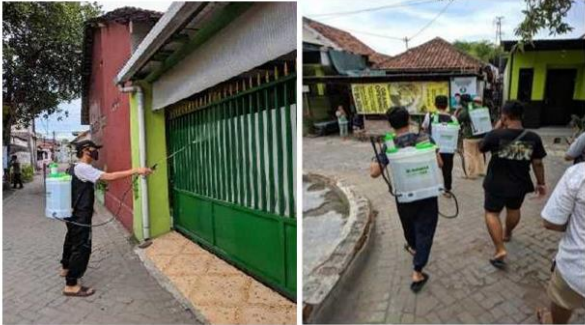
Gambar 2 : Penyemprotan Cairan Desinfektan