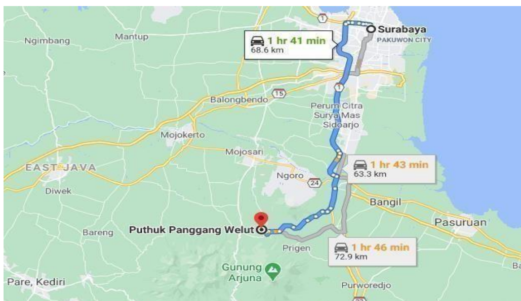
Gambar 1. Peta Wilayah Desa Nogosari Wisata Puthuk Panggang Welut

Gambar 1 menunjukkan peta wilayah Desa Nogosari Wisata Puthuk Panggang Welut