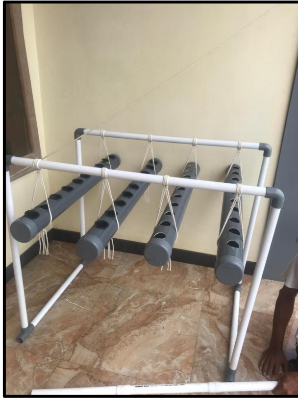
Gambar III : hasil hidroponik setelah di rakit