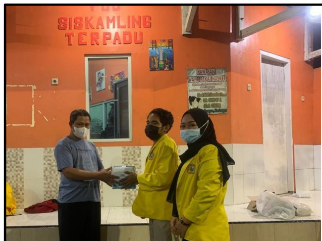
Gambar VI : proses pemberian masker dengan diwakili oleh koordinator gang setempat

Diadakan pembagian masker karena kuliah kerja nyata ini dilakukan bertepatan dengan adanya pandemi covid-19 yang artinya masker sangat dibutuhkan dan sangat berguna untuk masyarakat Indonesia khususnya masyarakat kampung Siwalankerto Raya V.