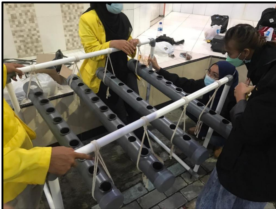
Gambar IV : hidroponik siap di pakai dan di posisikan dekat pos