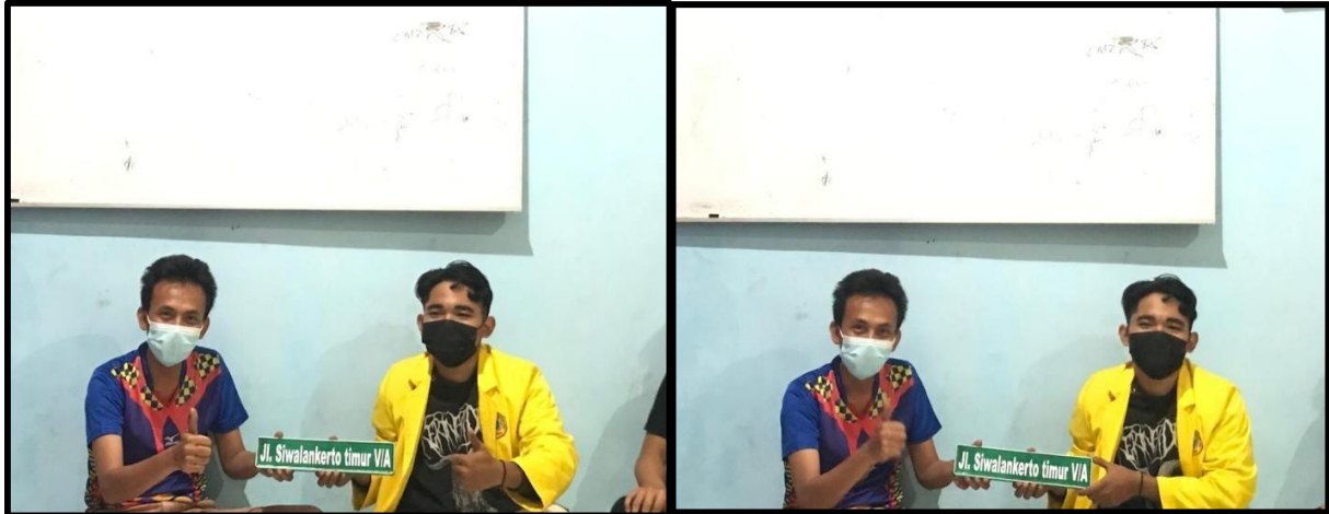
Gambar VII : Penyerahan plakat gang kepada koodinator gang

Membuat plakat gang sangat di butuhkan karena plakat gang sangat diperlukan jika ada yang berkunjung di kampung tersebut sehingga tidak kebingungan untuk mencari gang tersebut. Olehkarena itu kelompok 79 berencana membuat plakat gang dikarnakan plakat gang yang terdahulu sudah sedikit rusak.