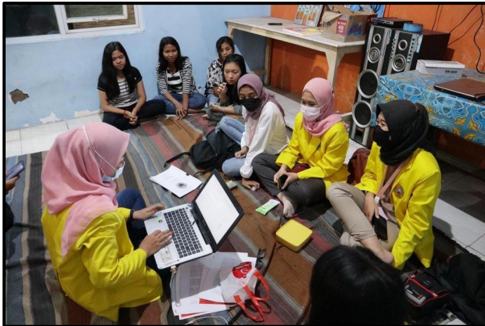
Gambar V : pembahasan tentang market place

Diadakan program ini karena di kampung Siwalankerto Raya V banyak masyarakat yang memiliki UMKM dan juga sudah mendaftar di beberapa marketplace tetapi hanya sebagian. Oleh karena itu kami bermaksud untuk memberikan pengetahuan lebih yang kami punya untuk masyarakat setempat. Agar mereka dapat memahami dan mengerti bagaimana mendaftarkan UMKM mereka, karena adanya pandemi kami semaksimal mungkin untuk tidak membuat kerumunan untuk memenuhi protokol kesehatan sehingga kami memberika hardcopy untuk warga dengan melalui ketua koordinator gang