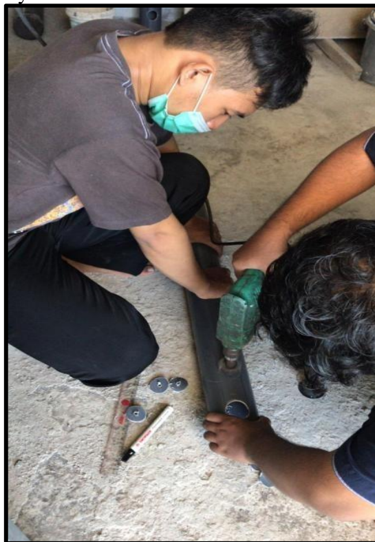
Gambar II : proses pelubangan paralon untuk hidroponik

Selain itu jika terdapat tanaman yang mati mudah diganti dengan tanaman baru, bila dibudidayakan secara ramah lingkungan, produk hidroponik lebih sehat dan aman untuk dikonsumsi oleh karena itu menggunakan komponen yang bebas kontaminasi mikroorganisme dan pestisida yang berbahaya.