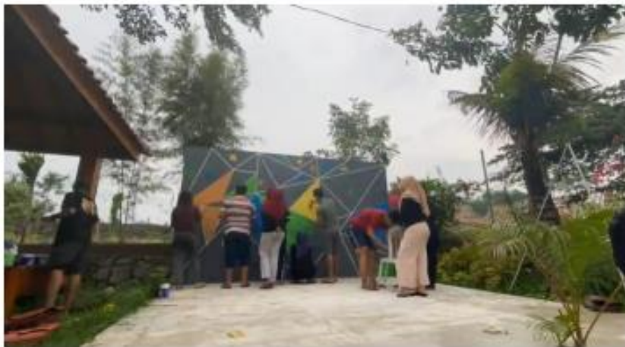
Gambar 6. Proses Pembuatan Spot Foto