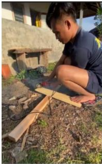
Gambar 4. Proses Pembuatan Plang Jalan