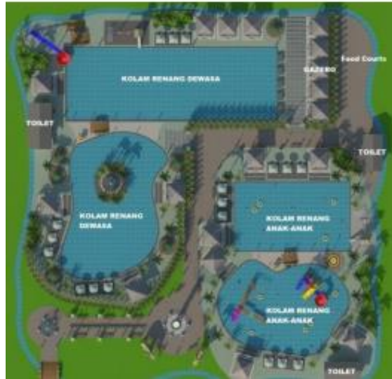
Gambar 1. Rancangan Desain Kolam Renang

Dalam proses kegiatan ini terdapat beberapa lampiran foto dalam proses kegiatan KKN ini :