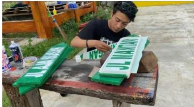
Gambar 5. Proses Plang Selesai