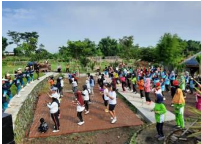
Gambar 10. Senam Lansia dan penggalangan dana Anak Yatim Piatu