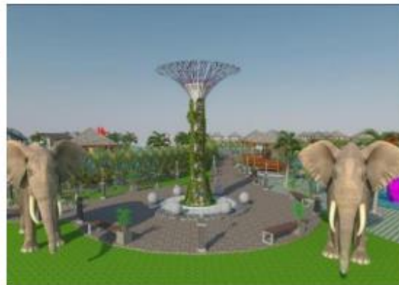
Gambar 3. Rancangan Desain Alun-Alun Isi Dalamnya