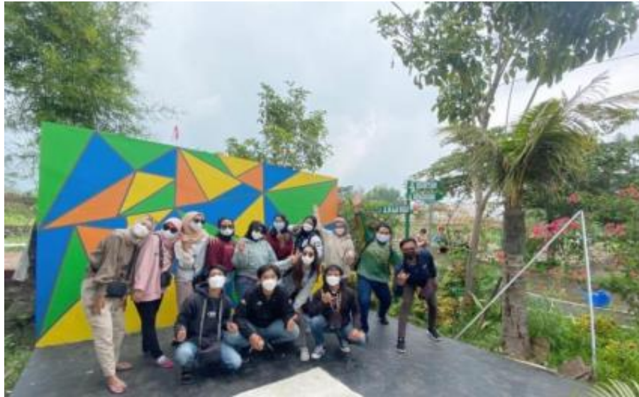
Gambar 8. Hasil Spot Foto