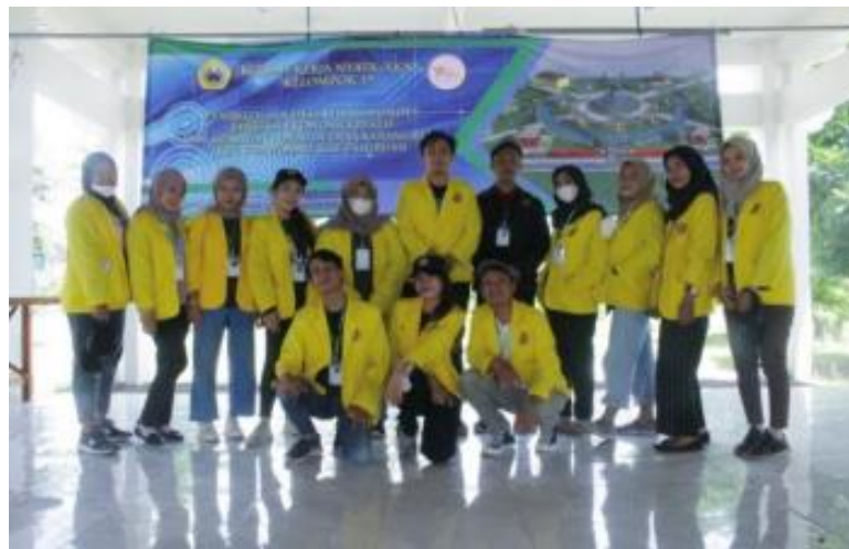
Gambar 11. Foto Kelompok