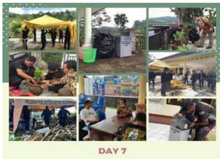
Gambar 8.

Dalam rangka mendukung proses keindahan alam sekitar desa khususnya pada area balai desa duyung, kami memberikan sejumlah tanaman dan juga bak sampah di area balai desa. Kami juga membersihkan lingkungan sekitar sehingga area balai desa terlihat lebih indah dan asri.