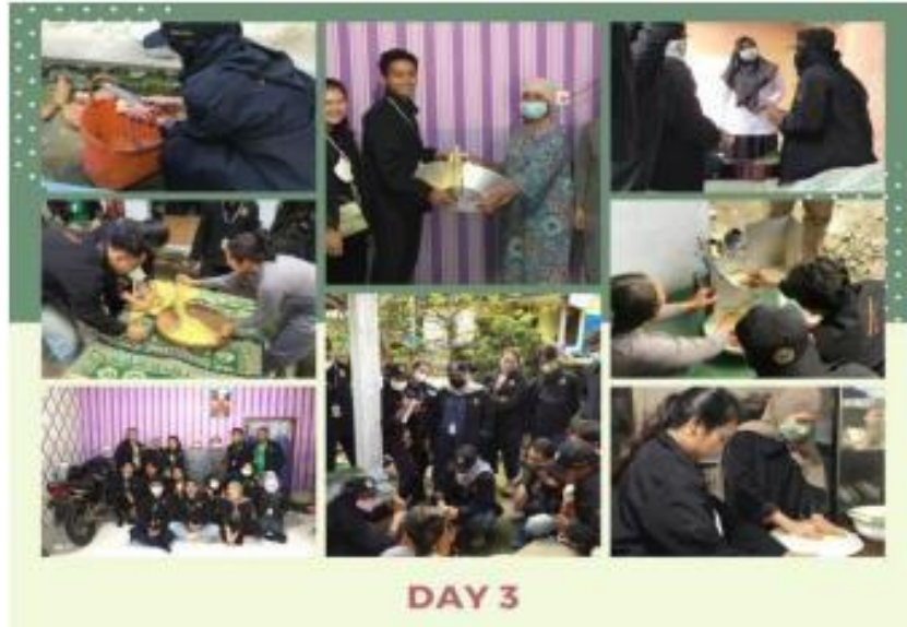
Gambar 4.

Duyung Kegiatan ini kami lakukan agar kami mengetahui kualitas dan kuantitas produk yang dijual oleh UMKM di Desa Duyung. Dengan demikian kami dapat mengetahui produk mempunyai cita rasa yang khas untuk diperjual belikan serta bersaing dengan produk keripik samiler dari luar desa.