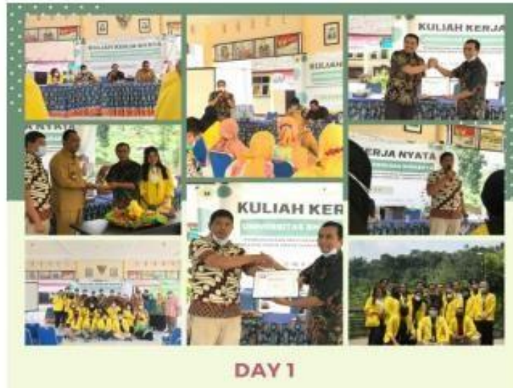
Gambar 2.

Bertempat di Balai desa Duyung tanggal 22 November 2021, Kelompok 020 KKN tematik Universitas Bhayangkara Surabaya melakukan pembukaan KKN dengan dihadiri Dosen Pembimbing Lapangan, Kepala desa beserta perangkat desa lainnya, Ibu-Ibu PKK, Warga Desa Duyung, dan Mahasiswa kelompok KKN Tematik saling memperkenalkan diri satu sama lain dan bersilaturahmi. Kegiatan pembukaan ini juga dihadiri oleh pemateri sosialisasi dari polda Jatim guna memberikan informasi tentang maraknya deskriminasi dan berita hoax