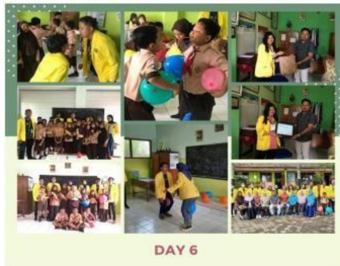
Gambar 7.