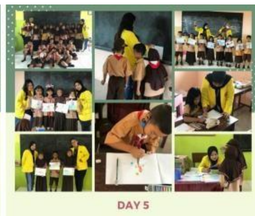
Gambar 6.