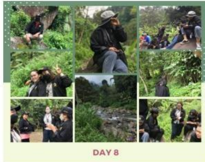
Gambar 9.

Pada hari ke delapan tanggal 28 November kami melakukan kegiatan peninjauan lokasi yang nantinya akan menjadi wisata baru bertempat di dusun Bantal, desa Duyung dan kami juga melakukan dokumentasi untuk membantu warga desa duyung lebih mengenalkan wisata yang akan dibuka.