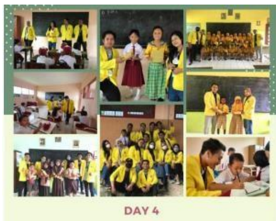
Gambar 5.

Kegiatan ini berlangsung selama tiga hari dimulai dari hari Kamis, 25 November 2021 sampai dengan hari Sabtu, 27 November 2021. Bertepatan dengan hari guru tanggal 25 November tentunya kami selaku kelompok peneliti sangat menghormati jasa guru membebaskan guru untuk beristirahat bergantian dengan mengajak siswa-siswi SD Negeri Duyung belajar menggunakan cara yang lebih seru seperti melakukan pemanasan otak (senam otak) lalu melakukan pendekatan dengan sharing-sharing pengalaman mereka setelah itu melakukan lomba guna mempererat hubungan.