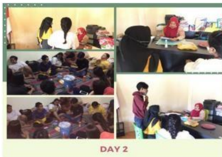
Gambar 3.

Dilakukannya persiapan ini agar tidak adanya misskomunikasi pada saat berlangsungnya kegiatan. Perlunya merapatkan kembali kepada perangkat desa tentang ikut sertanya kelompok peneliti dalam proses pembuatan kripik samiler di salah satu rumah UMKM kripik samiler di desa Duyung agar pada saat kegiatan kelompok peneliti tidak dianggap tidak sopan.