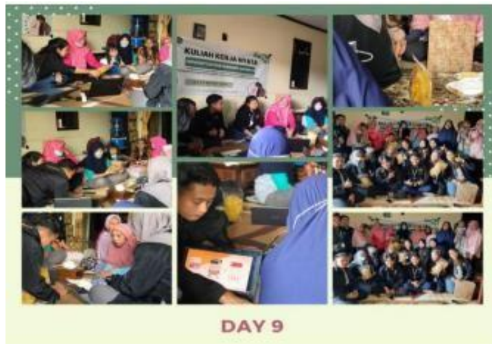
Gambar 10.

Kegiatan sosialisasi tentang pengemasan dan pemasaran produk dilakukan pada hari ke sembilan dan berokasi di rumah ibu kepala dusun Duyung Maksud dari kegiatan ini adalah sebagai mahasiswatetunya harus memiliki ide, inovasi, dan wawasan yang bagus. Oleh karena itu kami ingin mengubah pola pikir masyarakat desa melalui kemasan produk jual UMKM di desa duyung menjadi lebih menarik serta memberikan informasi tentang pemasaran produk melalui media sosial terutama pada shopee yang saat ini sedang trend dikalangan masyarakat umum.