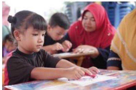
Gambar 5. Kegiatan lomba mewarnai