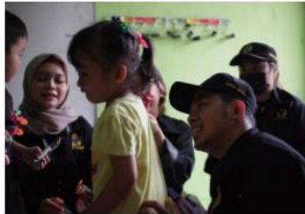
Gambar 4. Mengajar Di Hari Pertama Di Paud Pelangi Wedoroanom