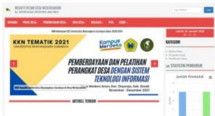
Gambar 2. Tampilan Interface Website desa.id.