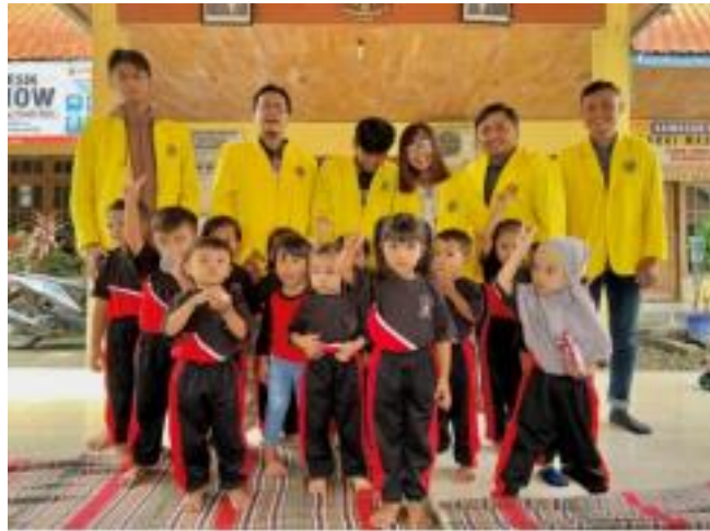
Gambar 7. Foto Bersama Paud Pelangi Wedoroanom