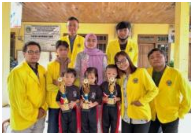
Gambar 6. Penyerahan Hadiah Lomba Mewarnai