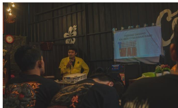
Gambar 2. Sosialisasi Enterpreneur

Dengan adanya sosialisasi ini diharapkan pemuda Desa Claket dapat meningkatkan perekonomian keluarga dan menjaga kekayaan alam desa Claket agar tidak diambil oleh negara lain yang ingin menguasai kekayaan alam Desa Claket Mojokerto. Serta dengan adanya sosialisasi ini pemuda Desa Claket dapat memperkenalkan usaha rumahnya melalui media sosial salah satunya melalui Instagram .