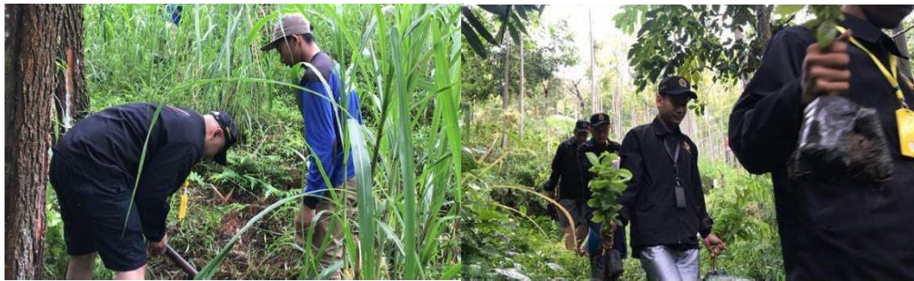
Gambar 7. menanam bibit sisrsak di Hutan Tambal Sulam

Melihat kondisi masyarakat Desa Claket yang memiliki peternakan sapi perah, Mahasiswa KKN Universitas Bhayangkara Surabaya bersama 3 Dokter memberikan sosialisasi Kesehatan mengenai bahaya cacing. Penyakit ini disebabkan oleh cacing hati yang disebabkan oleh cacing Fasciola Sp. yang hidup didalam hati empedu, ternak yang rentan adalah sapi, kerbau dan kambing, cacing ini dapat menularan pada manusia serta kematian pada ternak pada infentasu yang parah 10