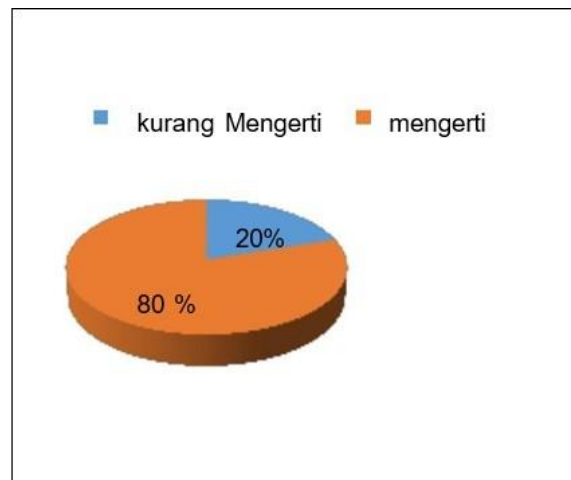
1.1 Bagan Sesudah Sosialisasi

Dari bagan menunjukkan bahwa setelah kegiatan KKN tematik ada peningkatan pemahaman mengenai sosialisasi Kesehatan dan Sosialisasi Enterreneur. Sebelum adanya kegiatan KKN tematik ini warga dan pemuda karang taruna hanya 25% yang mengetahui tentang bahaya cacing pada ternak sapi dan jiwa jiwa Enterpreneur pada pemuda. Namun setelah kami mengadakan sosialisasi kesehatan, sosialisasi enterpreneur dan pemasaran produk melalui media sosial hasil menunjukkan warga dan pemuda Desa Claket menjadi lebih paham dan meningkat menjadi 80%.