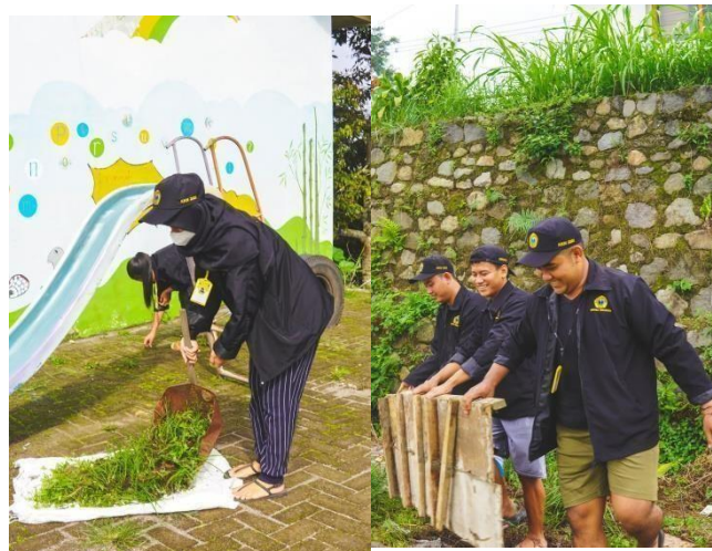
Gambar 8. Membersihkan Lapangan dan Paud