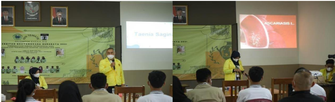
Gambar 5. Sosialisasi Kesehatan