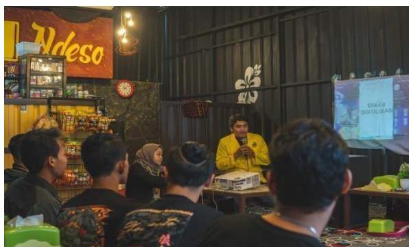
Gambar 1. Sosialisasi Enterpreneur

Kegiatan Sosialisasi Enterpreneur kepada Karang Taruna dan KOMPPACK sebagai pemuda Desa Claket Kecamatan Pacet Kabupaten Mojokerto dan juga dihadiri pemilik usaha Kripik Gunung Lirang.