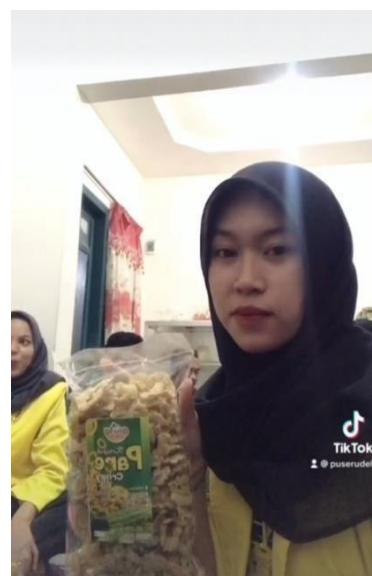
Gambar 4. Pemasaran melalui media tiktok

Megenalkan pemasaran produk melalui media sosial dirasa lebih cepat, efektif dan biaya lebih murah 8 . Kami juga membuatkan akun Instagram @gununglirang_snack dan memberikan arahan kepada pemilik usaha bagaimana cara menggunakan media sosial. Dan juga kami mempromosikan produk Kripik Gunung Lirang melalui media Tiktok yang sekarang sangat digandrungi semua kalangan masyarakat. Promosi melalui media sosial dengan tujuan untuk mempengaruhi keputusan pembeli konsumen dengan memberikan informasi informasi kepada konsumen seputar produk 9 Kripik Gunung Lirang. hal tersebut bertujuan agar pemilik usaha dapat mengembangkan usahanya dan mengenalkan usahanya lebih luas melalui media sosial.