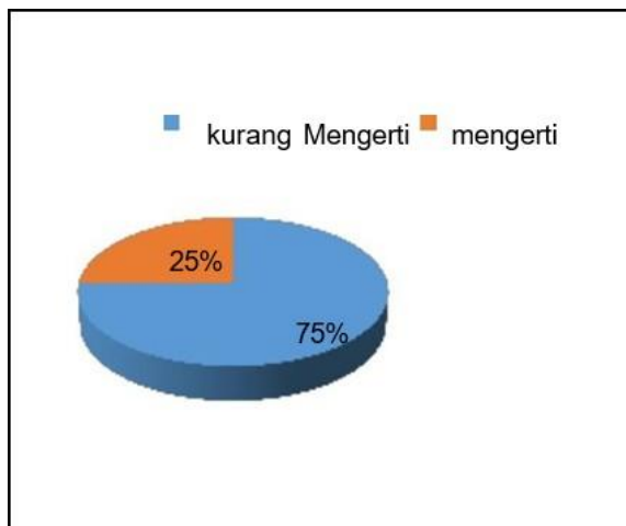
1.0 Bagan Sebelum Sosialisasi

Hasil Survey sebelum dan sesudah kegiatan KKN Tematik: