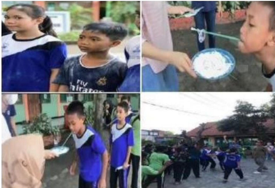
Gambar 8. Kegiatan Games