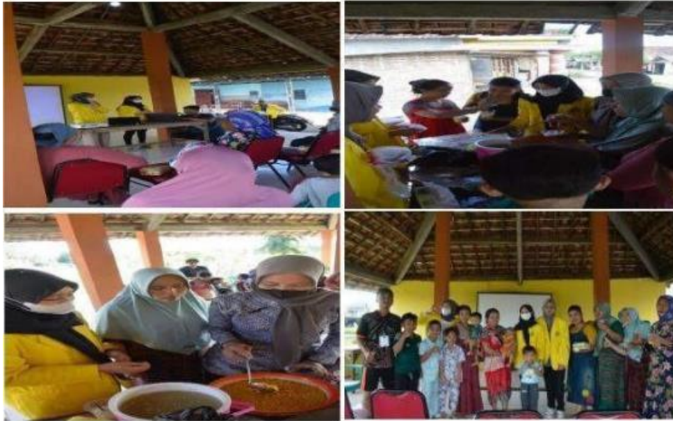
Gambar 6. Pembuatan Produk Minuman Jagung