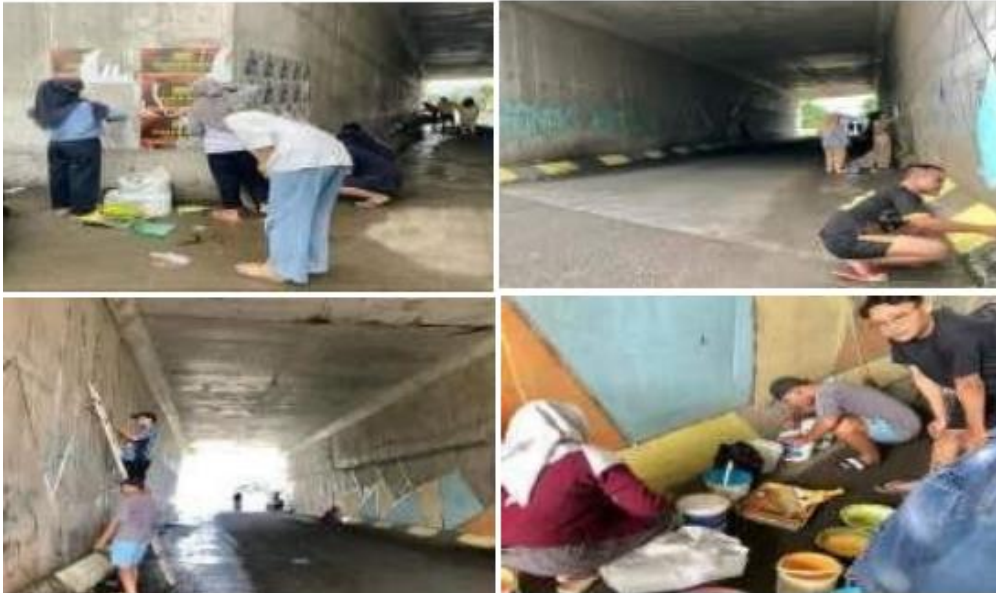
Gambar 5. Pembuatan Spot Foto di Terowongan Jalan Tol