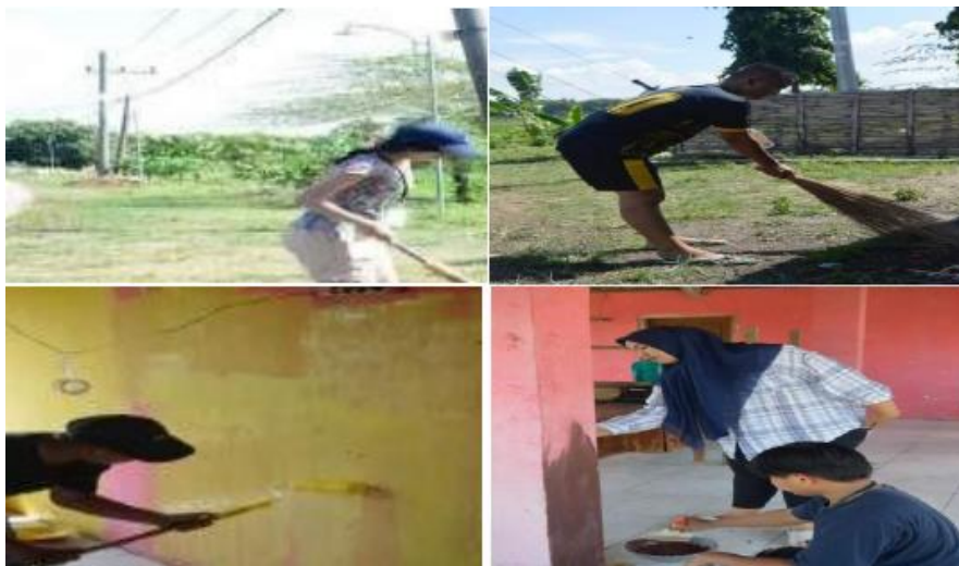
Gambar 3. Pengecatan Pos Ronda dan Kerja Bakti