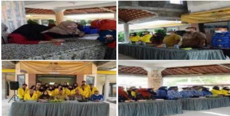
Gambar 2. Pembukaan Kegiatan KKN