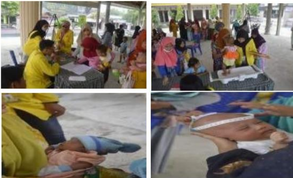
Gambar 4. Dilaksanakan Kegiatan Posyandu