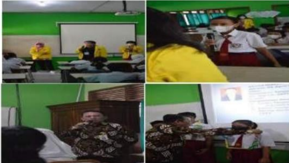
Gambar 7. Penyuluhan Narkoba Kepada Anak SD