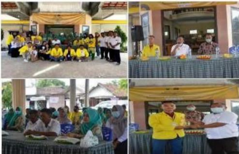
Gambar 9. Penutupan KKN