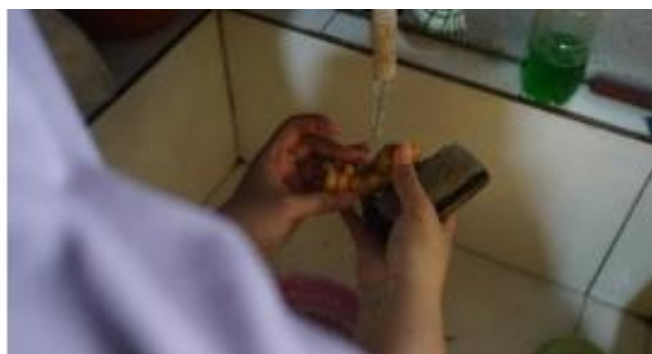
Gambar 4. Proses Pencucian Jahe