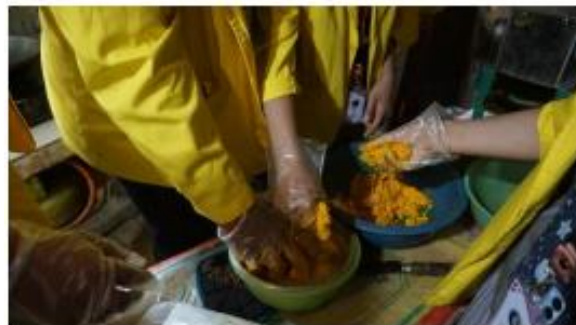
Gambar 6. Proses Pemerasan Ampas Jahe Untuk Diambil Sarinya (Setelah Dicampur Dengan Air)