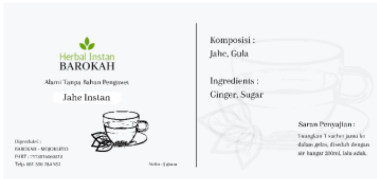
Gambar 2. Hasil design Kemasan dan Label

Untuk membuat kemasan produk Jamu Bubuk Barokah lebih menarik maka KKN Tematik UBHARA Kelompok 015 mendesign kemasan dan label yang sudah mencakup identitas produk Jamu Bubuk Barokah. Berikut adalah hasil design kemasan dan label dari KKN Tematik UBHARA Kelompok 015 :