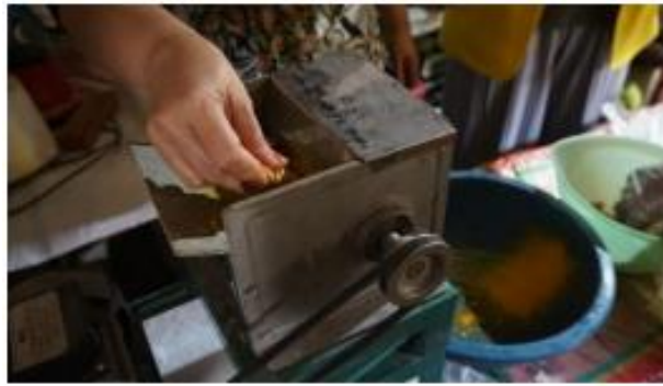
Gambar 5. Proses Penggilingan Jahe Dengan Mesin Giling