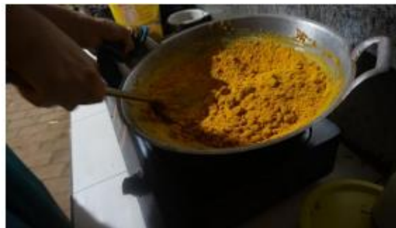
Gambar 8. Proses Akhir Pengadukan Sari Jahe Hingga Berubah Menjadi Gumpalan Bubuk