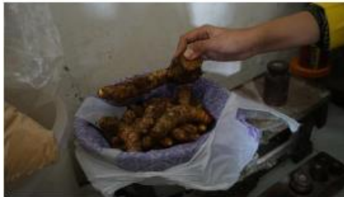
Gambar 3. Proses Penimbangan Jahe Untuk Rasio 1 : 1 (Jahe 1 kg dan Gula 1 kg)

Bubuk Barokah Proses pembuatan Jamu Bubuk Barokah ini tidak ada resep rahasia, namun kuncinya terletak pada tangan sang pembuat Jamu Bubuk. Satu demi satu proses pembuatannya masih dikerjakan secara manual. Hasil dari proses pembuatan Jamu Bubuk Barokah dilampirkan sebagai berikut :