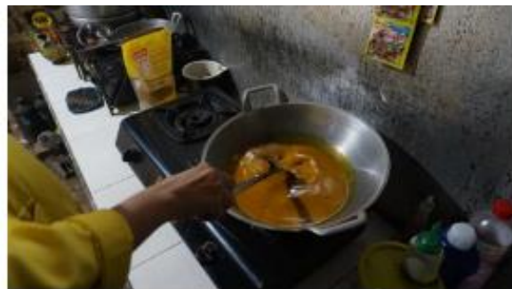
Gambar 7. Proses Awal Pengadukan Sari Jahe