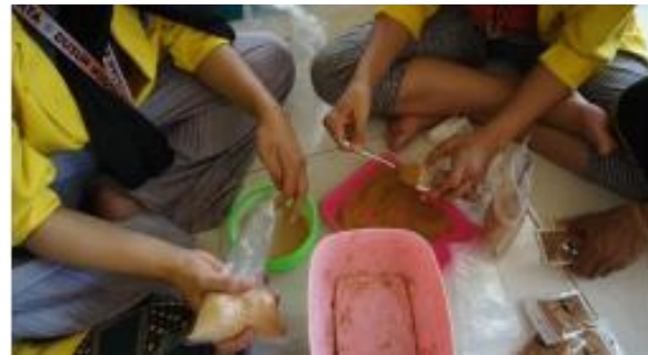
Gambar 10. Proses Memasukkan Jamu Bubuk Kedalam Kemasan Berlabel