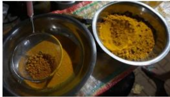
Gambar 9. Proses Menyaring Bubuk dari Gumpalan