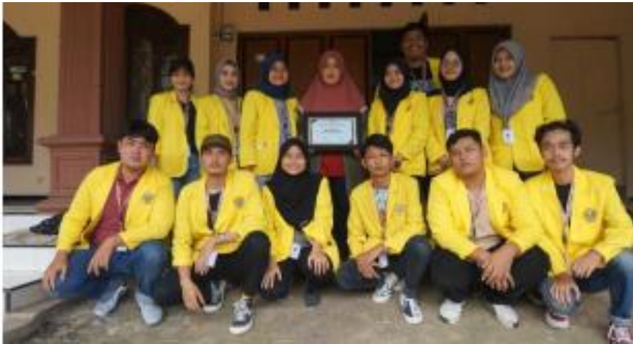
Gambar 12. Foto pemilik UMKM Jamu Bubuk Barokah beserta anggota KKN Tematik UBHARA Kelompok 015