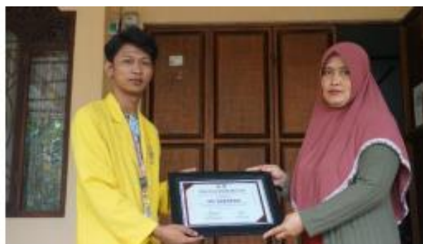
Gambar 11. Penyerahan Sertifikat Penghargaan Kepada UMKM Jamu Bubuk Barokah oleh Koordinator KKN Tematik UBHARA Kelompok 015