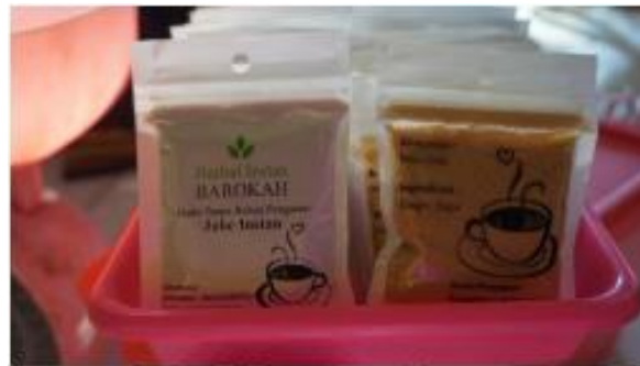
Gambar 11. Foto Produk Jadi Jamu Bubuk Barokah