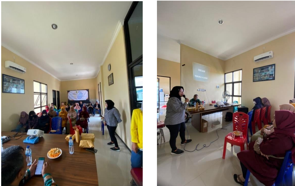
Gambar 5. Kegiatan Sosialisasi Bahaya Narkoba Dan Obat-Obatan Terlarang