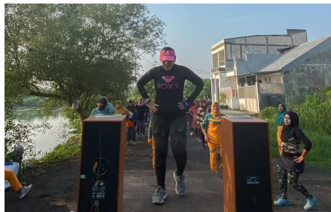
Gambar 4. Kegiatan Senam Bersama