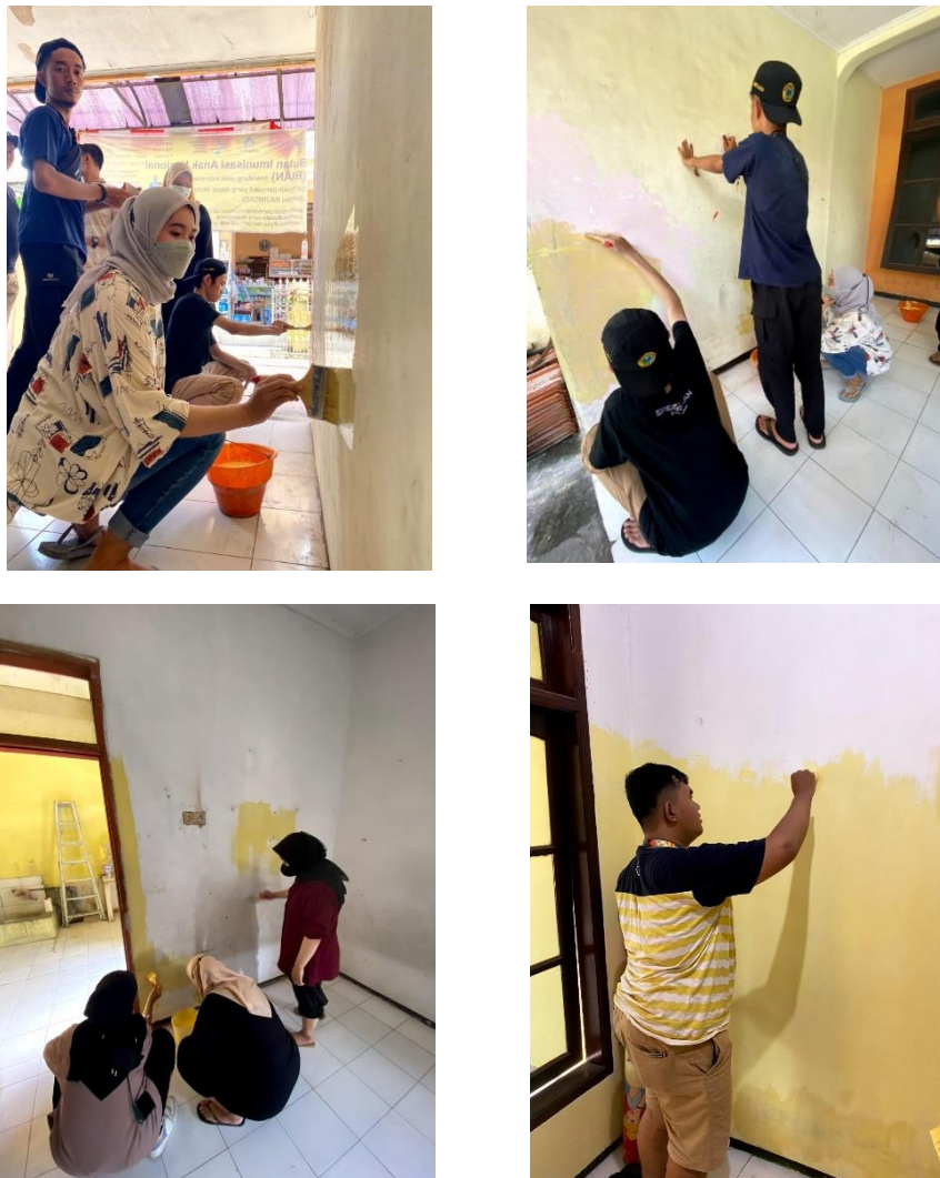
Gambar 3. Kegiatan Perbaikan Posyandu.

Dalam rangka ini kami membantu Desa Tambak Oso melakukan perbaikan berupa pengecatan dan pembersihan posyandu yang masih aktif di oprasikan akan tetapi kurangnya perhatian dari pihak desa atas kenyamanan penggunaan pelayanan warga . Peran posyandu adalah sebagai wahana pelayanan dari berbagai program. Kegiatan Posyandu perlu memerhatikan aspek pemberdayaan masyarakat secara konsisten. Oleh karena itu, untuk dapat meningkatkan mutu posyandu, kami melakukan kegiatan perbaikan ini agar posyandu dapat digunakan secara layak dan pelayanan secara maksimal.