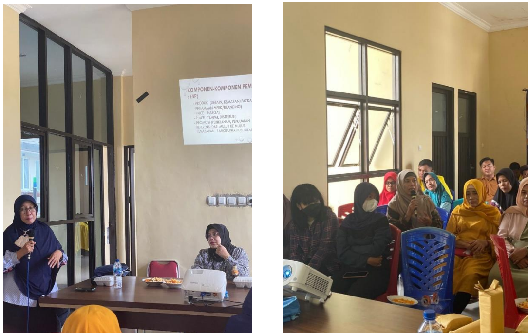
Gambar 6. Kegiatan Sosialisasi Pemasaran Produk Secara Digital

Selain media sosial , packing juga menjadi hal penting karna pengemasan produk berbahan dasar ikan akan lebih cepar rusak kalau tidak di packing dengan benar. Dengan ada nya sosialisasi yang kami adakan ini khususnya umkm bisa berinovasi mengenai pengemasan produk produk mereka.