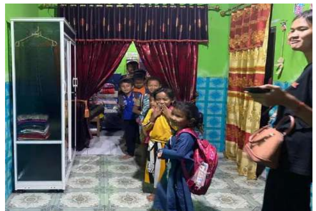
Gambar 7. Pengadaan Acara Lomba dengan Murid-Murid SD / Madrasah dan Pembelajaran Bersama dengan Anak-Anak Dusun Kluwih