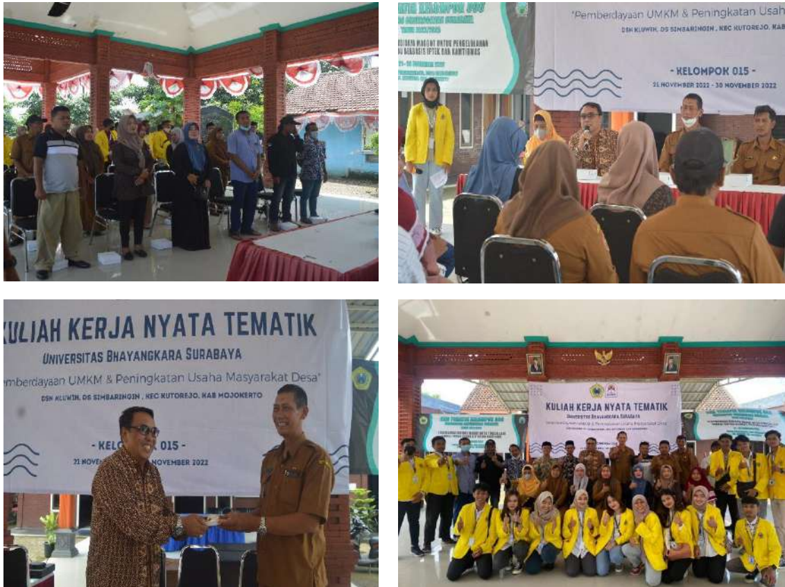
Gambar 2. Pembukaan Kegiatan KKN