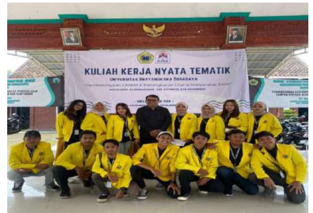
Gambar 10. Penutupan KKN Tematik Kelompok 015 di Desa Simbaringin