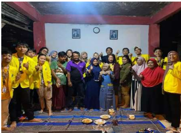
Gambar 5. Sosialisasi KAMTIBMAS (Materi : Bencana Sosial)