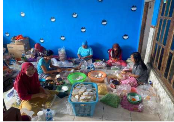
Gambar 3. Pengaplikasian Inovasi Packaging Produk Baru Untuk UMKM “Jajanan Rambut Nenek”