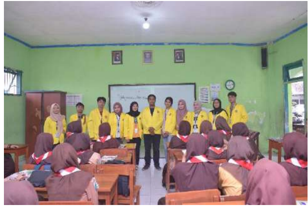
Gambar 6. Sosialisasi Edukasi di Pondok Pesantren Al Masudy