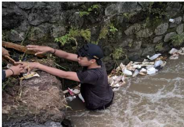
Gambar 4. Gotong Royong Membersihkan Aliran Sungai dari Sampah dan Lingkungan Sekitarnya