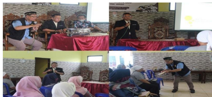
Gambar 3. Penyuluhan Pentingnya Hak Atas Kekayaan Intelektual untuk Pengembangan UMKM Masyarakat Desa

Maka dari itu Mahasiswa KKN Universitas Bhayangkara Surabaya melakukan penyuluhan tentang pentingnya Hak Kekayaan Intelektual dan cara mendaftarkan merek usahanya untuk pengembangan UMKM masyarakat desa. Program tersebut diikuti oleh 15 orang warga Kesimantengah yang merupakan para pelaku UMKM. Penyuluhan yang dilakukan berjalan lancar dengan banyaknya pertanyaan yang diberikan dari para peserta pelaku UMKM.