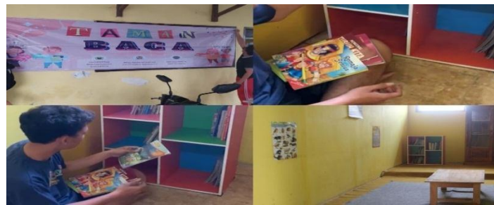
Gambar 2. Hasil Finishing Taman Baca Desa Kesimantengah