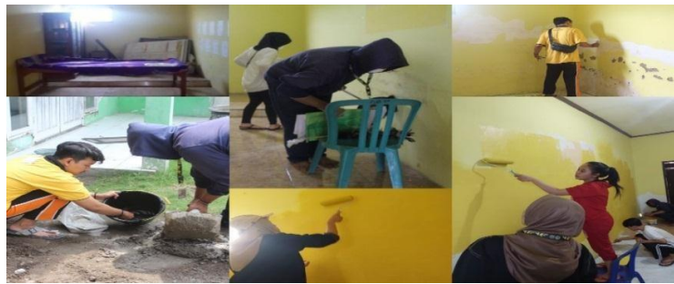
Gambar 1. Proses Renovasi Ruang Taman Baca