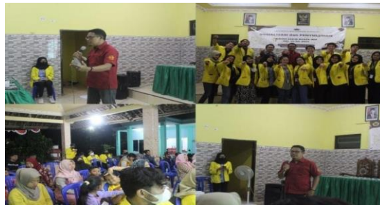
Gambar 4. Sosialisasi Peningkatan Minat Baca Melalui Digitalisasi Perpustakaan

Sosialisasi yang kami adakan untuk masyarakat Desa Kesimantengah dengan bertujuan membangun motivasi minat membaca dan mendekatkan masyarakat kepada buku sehingga budaya membaca dapat terbentuk dilingkungan masyarakat melalui program kerja "Taman Baca" yang kelompok kami dirikan di Desa Kesimantengah. Adapun fungsi dari sosialisasi ini menghimbau masyarakat Desa terutama para orang tua bahwa kami telah menyediakan fasilitas yang telah dibutuhkan oleh anak bangsa dengan melihat data yang ada pada Central Connecticut State University (CCSU) yaitu bangsa Indonesia rendah dalam membaca. Dengan ini, sasaran yang kami galakkan terutama usia dini seperti TK-SD. Selain itu, Taman Baca ini akan dijadikan sebagai tempat yang produktif baik untuk anak-anak, warga sekitar, ataupun guru yang telah kami konfirmasi untuk merawat dan senantiasa mengajak para murid untuk mengunjungi Taman Baca Desa Kesimantengah demi keberlanjutan program kerja kami agar manfaat tetap mengalir dan berjalan seperti yang kami harapkan.