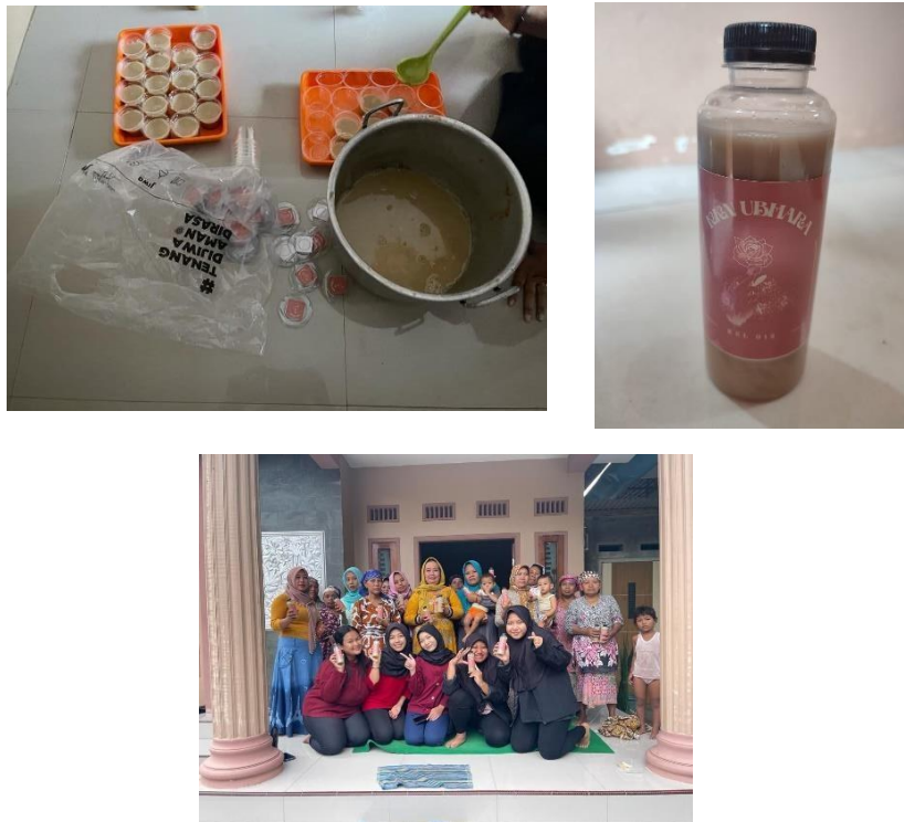
Gambar 8. Program Kerja Demo Masak Bersama Ibu-Ibu PKK