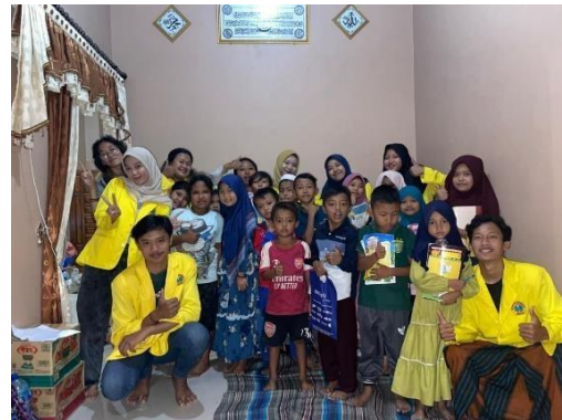
Gambar 5. Kegiatan belajar mengajar hari rabu untuk anak-anak SD didesa kalisat