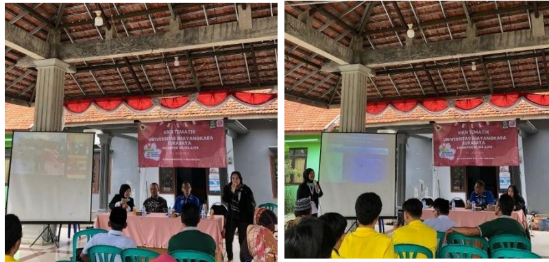
Gambar 2. Kegiatan Sosialisasi di Pasuruan