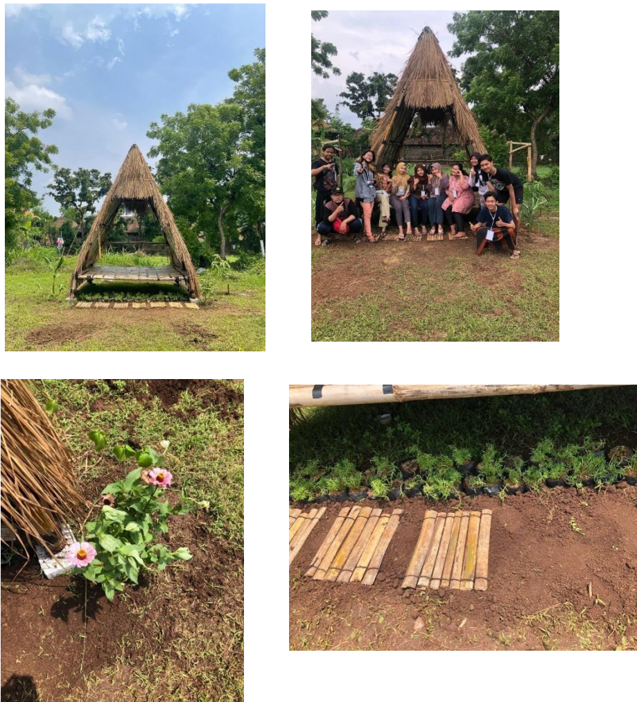
Gambar 3. Pelaksanaan Program Kerja Pembangunan Gazebo Bambu, Penanaman Tumbuhan Serta Spot Foto