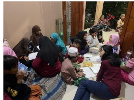
Gambar 6. Kegiatan belajar mengajar hari jumat untuk anak-anak SD didesa kalisat