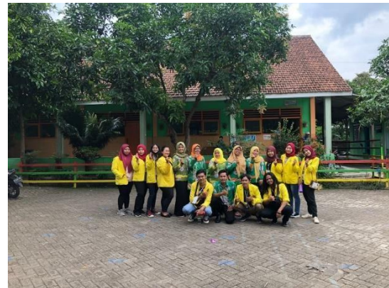
Gambar 7. Kegiatan Mengajar Kelas 2 SD Didesa Kalisat