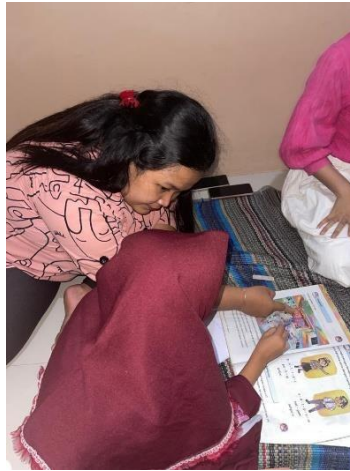
Gambar 4. Kegiatan Belajar Mengajar Hari Senin Untuk Anak-Anak SD Didesa Kalisat

Pada program kerja ini kami mengadakan kegiatan belajar mengajar untuk anak-anak SD. Kami memberikan edukasi dan membantu mereka dalam menyelesaikan tugas sekolah. Kegiatan ini dilaksanakan setiap 2 hari sekali. Pelajaran yang di bahas sangat beragam tergantung dari anak-anak SD kalisat.