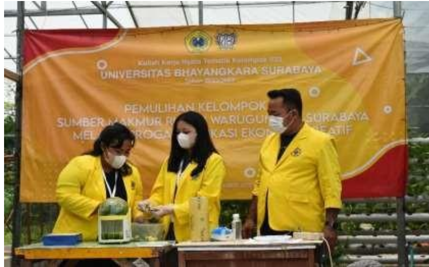
Gambar 3. Penyuluhan Pembuatan Minuman Sehat

Selain itu, untuk mendukung penjualan hasil panen tanaman hidroponik diberikan juga edukasi berbasis ekonomi kreatif yaitu: