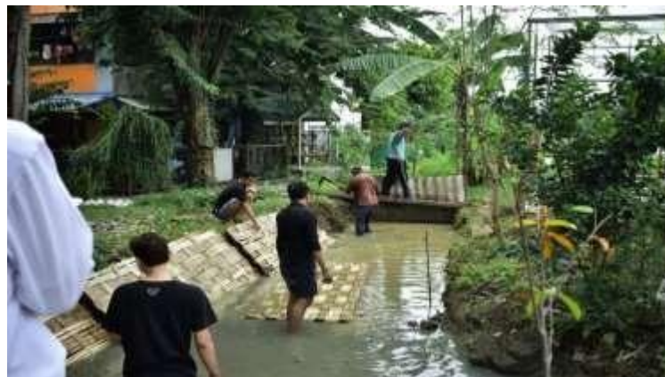
Gambar 4. Membersihkan Kolam Budidaya Ikan Lele

Dalam kegiatan ini, yaitu membersihkan kolam budidaya ikan lele yang lama tidak terurus tepatnya di Rusunawa Warugunung. Tujuan kegiatan ini dilakukan yaitu ingin mengaktifkan kembali kolam budidaya ikan lele.