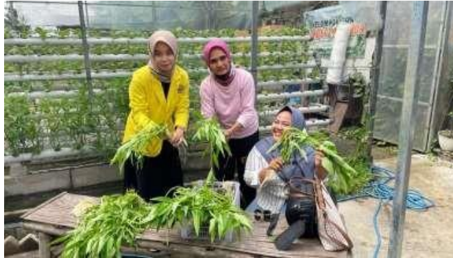
Gambar 5. Memanen Kangkung

Dalam kegiatan ini Kelompok 023 membantu warga kelompok tani Sumber Makmur untuk panen dan membersihkan area tanaman hidroponik. Tujuan kegiatan ini yaitu ingin mengetahui bagaimana cara panen serta membantu meringankan pekerjaan kelompok tani.