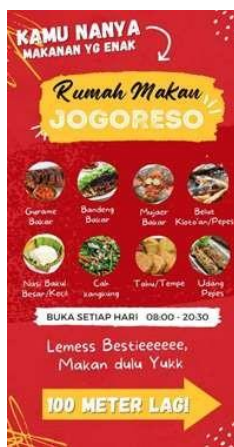
Gambar 3. Desain Benner