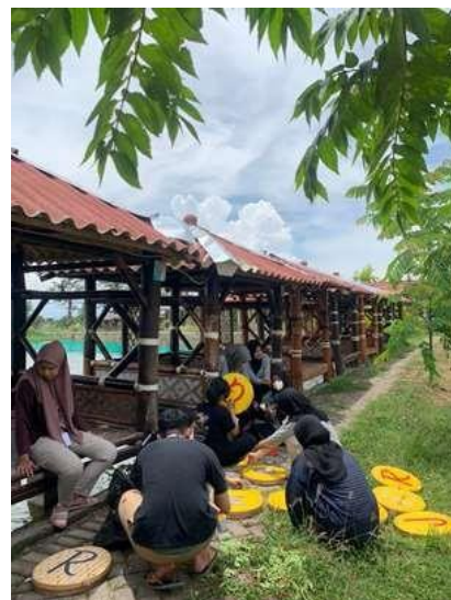
Gambar 2. Pengecatan Plakat Plakat