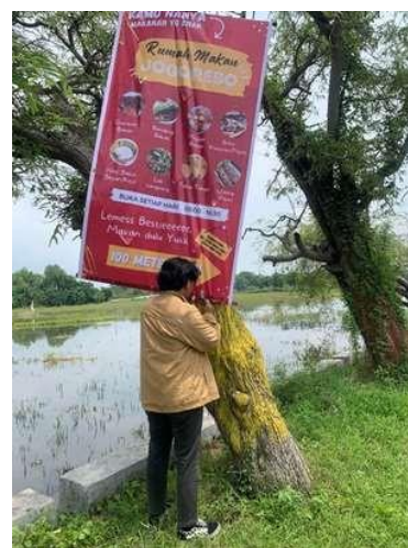
Gambar 4. Pemasangan Benner 1