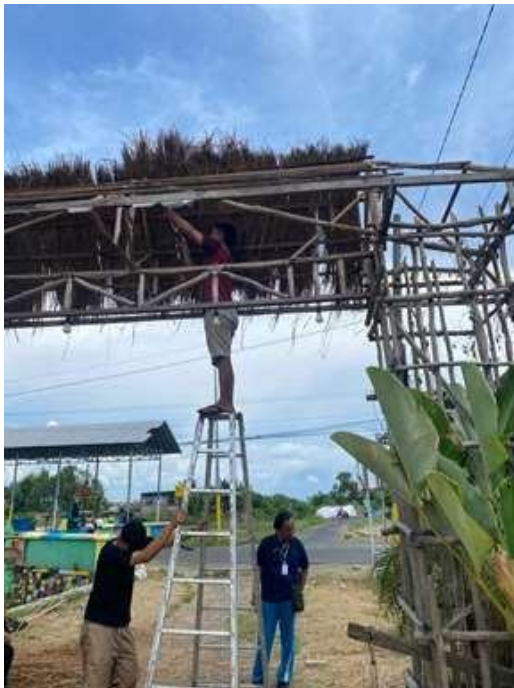
Gambar 5. Perbaikan Atap Gapura