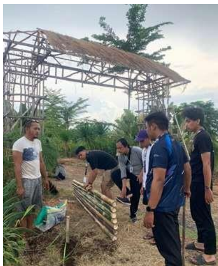
Gambar 1. Pemasangan Bambu Plakat

Kegiatan ini dilaksanakan mulai tanggal 11 November 2022 dengan pelaksanaan selama kurang lebih 10 hari dimana dalam kegiatannya dimulai dari proses pengecatan tulisan selamat datang dan plakat "RM Jogoreso", pemasangan bambu sebagai dinding plakat, perbaikan atap gapura, mendesain media promosi, pembersihan area rumah makan Jogoreso serta pemasangan benner di pinggir jalan sebelum memasuki desa Kedung Peluk.