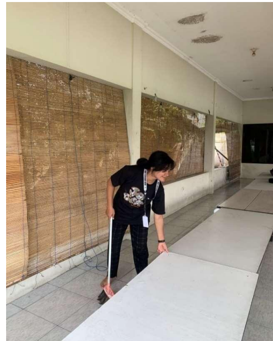
Gambar 6. Pembersihan Area Rumah Makan Jogoreso

Dari hasil observasi yang telah kami lakukan kepada masyarakat, kegiatan pengembangan BUMDES Jogoreso nantinya diharapkan para karyawan dan pengelola rumah makan dapat meningkatkan promosinya lebih baik lagi serta merawat rumah makan secara mandiri, dan diharapkan dapat membuat inovasi-inovasi baru untuk keberlangsungan BUMDES Jogoreso supaya dapat menjadi penggerak perekonomian desa. Sehingga kedepannya dapat menjadi lebih baik lagi dan lebih banyak peminat.