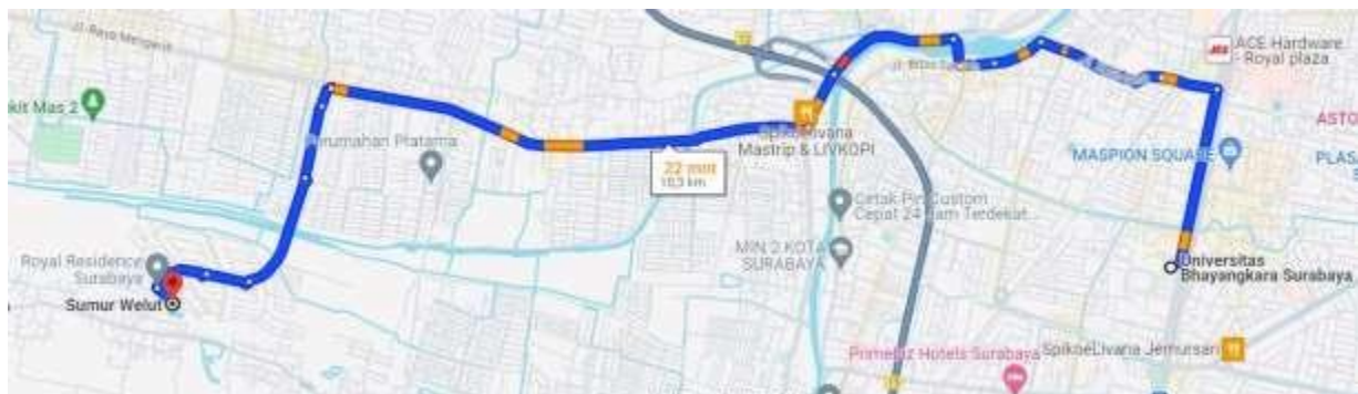
Gambar 1. Peta Perjalanan dari Ubhara Menuju Desa Sumur Welut

Desa sumur welut, kecamatan Laka Santri kabupaten Surabaya letaknya dekat dengan kabupaten Gresik area lokasi menuju desa banyak pabrik-pabrik. Jarak tempuh dari Universitas Bhayangkara Surabaya ke Desa Sumur welut kurang lebih 25 menit disesuaikan dengan lalu lintas (10,3 km) jika menggunakan kendaraan motor [ 2 ].