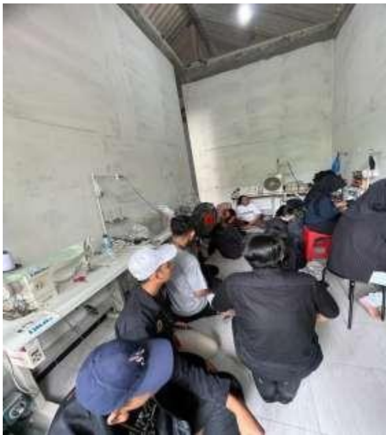
Gambar 9. Kunjungan UMKM

UMKM merupakan singkatan dari Usaha Mikro, Kecil, dan Menengah. Pada dasarnya, UMKM adalah arti usaha atau bisnis yang dilakukan oleh individu, kelompok, badan usaha kecil, maupun rumah tangga. Indonesia sebagai negara berkembang menjadikan UMKM sebagai pondasi utama sektor perekonomian masyarakat, hal ini dilakukan untuk mendorong kemampuan kemandirian dalam berkembang pada masyarakat khususnya dalam sektor ekonomi. Perkembangan UMKM di Indonesia terus meningkat dari segi kualitasnya, hal ini dikarenakan dukungan kuat dari pemerintah dalam pengembangan yang dilakukan kepada para pegiat usaha UMKM, yang mana hal tersebut sangat penting dalam mengantisipasi kondisi perekonomian ke depan serta menjaga dan memperkuat struktur perekonomian nasional.[5]