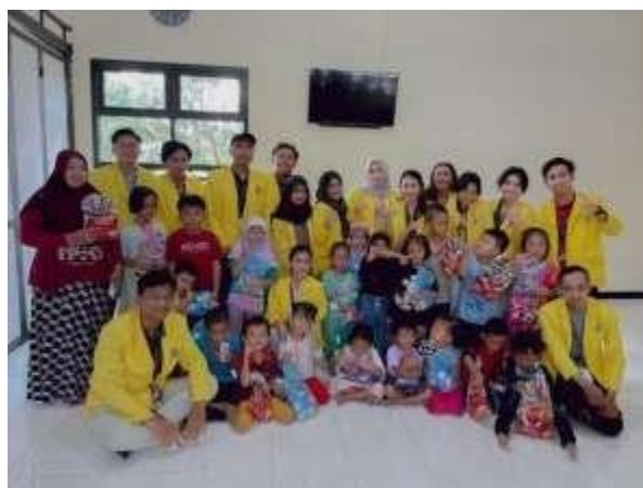
Gambar 5. Foto Bersama Setelah Materi Bullying

Program ini merupakan program yang bertujuan untuk mengedukasi anak-anak akan bahayanya bullying Selain itu, program ini bertujuan memberikan pemahaman kepada anak-anak tentang pentingnya aturan hukum yang berlaku, dan juga menumbuhkan kesadaran sejak dini tentang perlunya menghindari bullying dalam kehidupan sehari-hari. perbuatan bullying dapat merugikan orang lain bahkan dapat menyebabkan kehilangan masa depan seorang anak yang menjadi korban perbuatan tersebut sehingga kiranya untuk menghindari terjadinya hal-hal yang buruk terhadap anak-anak maka perlu diberikan pemahaman tentang bullying.