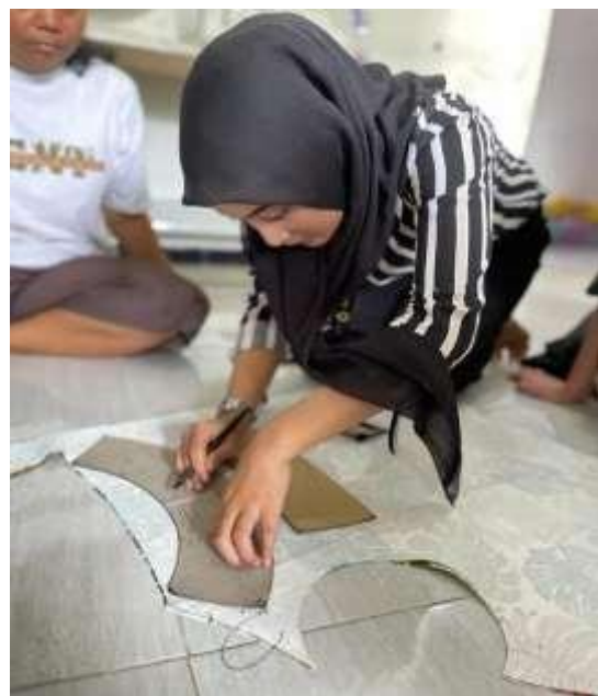
Gambar 10. Praktek Pembuatan Topi

Berikut dokumentasi kami membantu kegiatan umkm dikelurahan sumur welut pembuatan tas dan topi berbahan dasar kain perca yang akan dijual ke reseller atau pemesan, di bantu ibu ibu produksi kegiatan ini untuk menambah kreativitas dan soft skill mahasiswa dan juga menambah silaturahmi kami dan warga setempat.