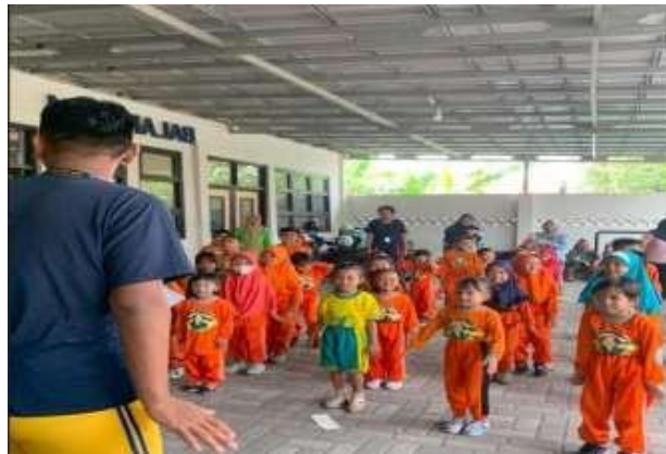
Gambar 6. Senam Bersama Anak TK

Senam memiliki manfaat yang signifikan bagi perkembangan anak-anak di Sekolah Dasar. Dengan berlatih senam secara teratur, anak-anak dapat meningkatkan kebugaran fisik mereka, memperbaiki kesehatan, meningkatkan koordinasi dan keterampilan motorik, meningkatkan konsentrasi, serta meningkatkan kepercayaan diri mereka. Oleh karena itu, penting bagi Sekolah maupun desa untuk memberikan pelajaran Jasmani yang mencakup kegiatan senam agar anak-anak dapat mengalami manfaat-manfaat ini dalam kehidupan sehari-hari mereka. Senam rutin dilakukan oleh anak-anak setiap hari Jumat di Balai Desa Kelurahan Sumur Welud didampingi ibu-ibu dan guru TK dalam kegiatan tim kelompok 017 menjadi instruktur senam pinguin dan ditirukan para adik-adik.