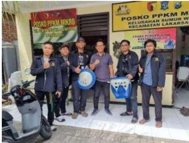
Gambar 12. Pemberian Beberapa Tong Sampah

dengan pemasangan cermin tikungan ini diharapkan bisa mengurangi terjadinya kecelakaan lalu lintas. Sebab, cermin tikungan yang berbentuk bulat dan cembung ini merupakan cermin pemandu jalan. Fungsi cermin ini akan memudahkan pengendara melihat kendaraan lain dari arah yang berlawanan.