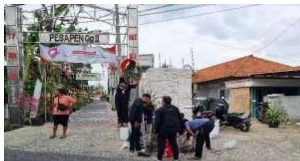
Gambar 11. Pemasangan Safety Mirror

Sesuai dengan aturan undang-undang tentang keselamatan lalu lintas, cermin cembung outdoor ini adalah alat keselamatan (alat safety) untuk membantu para pengguna jalan. Dengan dipasangnya cermin ini, tingkat kecelakaan akan menurun. Saat ini belum semua persimpangan atau belokan di jalan menggunakan cermin cembung, namun dengan berbagai edukasi yang diberikan, semoga kedepannya akan lebih banyak convex mirror outdoor yang dipasang.[6]