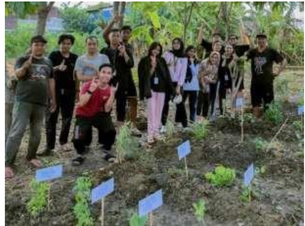
Gambar 4. Foto Bersama Setelah psenanam

Beberapa tanaman toga yg kami berikan dan juga manfaatnya adalah Jintan merupakan tanaman obat keluarga yang dimanfaatkan biji dari bunganya. Kandungan yang ada di dalam jintan terdapat antioksidan yang tinggi sehingga dapat menangkal radikal bebas. Daun sirih Kandungan plevonoland dan flavonoid yang dimiliki daun sirih dapat menjadi antioksidan, antiseptik serta antiinflamasi. Selain itu, kandungan uegonol dan karvakol juga dapat meredakan rasa sakit serta mengatasi bau mulut dan keputihan. Kunyit bagi kesehatan, yaitu meringankan radang usus buntu dan radang rahim, air perasan kunyit, kuning telur, kapur sirih dapat menyembuhkan radang amandel. Air perasan kunyit, isi buah pinang, kapur sirih dan madu dapat meringankan asma. Meringankan sembelit, menggunakan air perasan rimpang dicampur dengan garam. Dan masih banyak lagi jenis dan manfaat tanaman toga .[ 3 ]