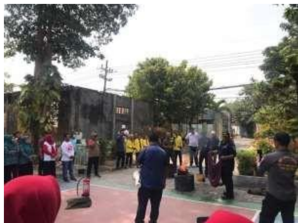
Gambar 8. Penyuluhan Damkar

Petugas pemadam kebakaran selain terlatih untuk menyelamatkan korban dari kebakaran atau melakukan pemadaman, juga dilatih untuk menyelamatkan korban-korban bencana seperti kecelakaan lalu lintas, gedung runtuh, banjir, gempa bumi, dll. Di lain hal, mereka juga ditugaskan untuk melakukan tugas-tugas penyelamatan yang tidak menyangkut adanya kebakaran seperti pengevakuasian sarang tawon, menyelamatkan korban bunuh