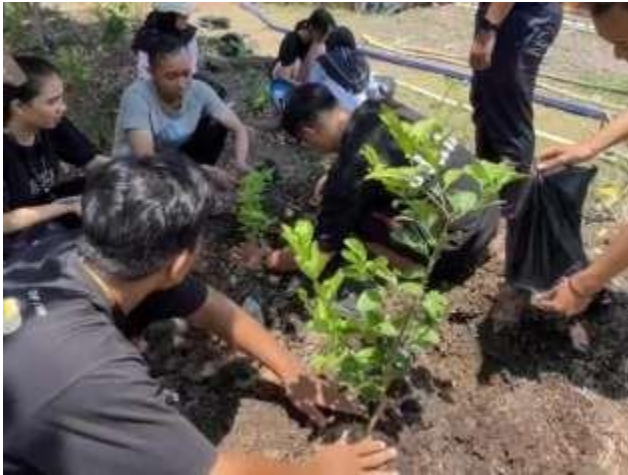
Gambar 3. Menanam Tanaman Toga