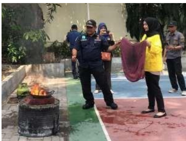
Gambar 7. Perwakilan Anggota KKN untuk Pemadaman Api

Program sosialisasi parenting ini bertujuan untuk memberikan pemahaman mengenai penyebab terjadinya kebakaran, memberikan pengetahuan dasar tentang upaya pencegahan kebakaran dan memberikan pelatihan dalam mengoperasikan Alat Pemadam Api Ringan, Hydrant dan lain-lain. Dengan adanya kegiatan sosialisasi pemadam kebakaran ini, diharapkan risiko sekecil apapun dalam musibah kebakaran dapat diminimalisir. Program ini diikuti oleh ibu-ibu KSH, ibu-ibu POKJA dan MADGASKAR Kelurahan Sumur Welut dilaksanakan di Kantor Kelurahan Sumur Welut dan mendapat respon positif dari audience.