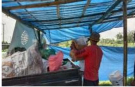
Gambar 4a). Sampah warga diangkut menggunakan pikap