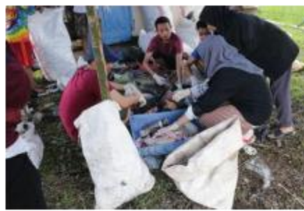
4d). Memasukan sampah yang sudah dipilah kedalam karung