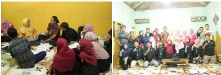
3c). Diskusi bersama ibu Ina mengenai bank sampah 3d). Foto bersama anak karang wonokoyo