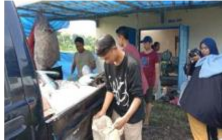
4b). Penurunan sampah dari pikap