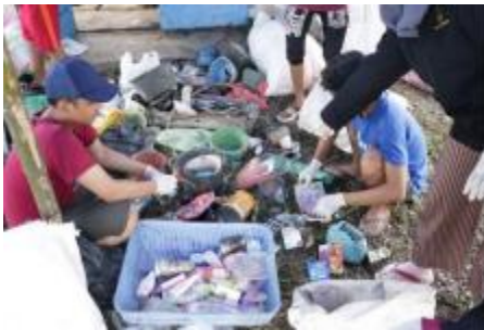
4c). Pemilahan sampah sesuai bahan dan jenis