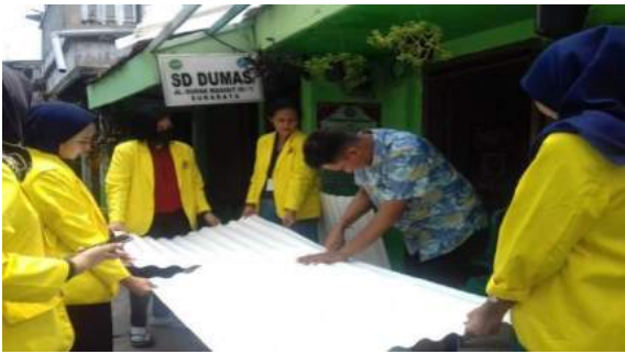
Gambar 22. Pemotongan dan pemasangan fiber.