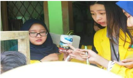
Gambar 24. Anggota KKN membagikan pot hidroponik kepada para siswa untuk di cek keadaan tanaman tersebut.