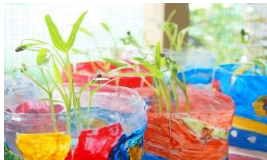
Gambar 34. Kondisi tanaman minggu ke 2.