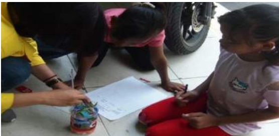
Gambar 26. Mengukur panjang tanaman kangkung di minggu pertama.