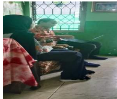
Gambar 17. Pemberian bimbingan serta koreksi atas kegiatan yang sudah dilakukan selama empat hari.