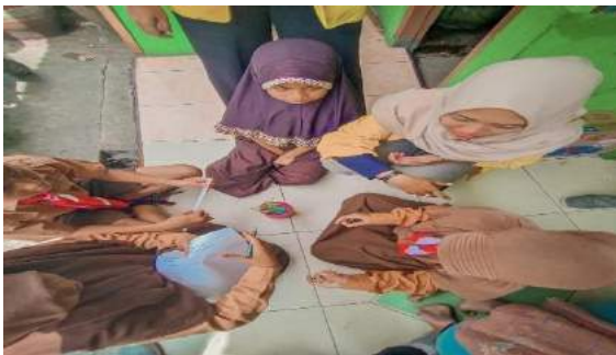
Gambar 33. Menghitung jumlah daun, tinggi tanaman, dan kadar PH dalam air.