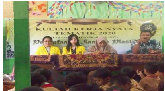
Gambar 4. Penyambutan oleh pihak yayasan sekaligus pembukaan pelaksanaan KKN, tidak ada penyambutan dari DPL dikarenakan sedang berada di luar kota.