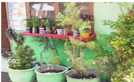
Gambar 32. Area depan kelas setelah ditanami dan ditata.