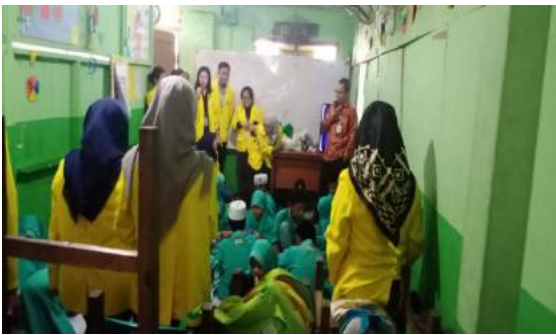
Gambar 16. DPL mengunjungi SD dan menyampaikan sambutan.