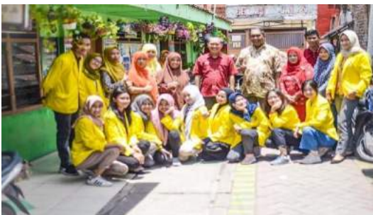
Gambar 39. Foto mahasiswa KKN bersama para guru SD Dumas, DPL serta tim Monev.