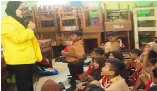
Gambar 1. Sie acara mengkondisikan siswa sebelum acara pembukaan KKN dimulai.