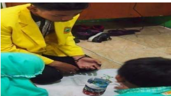
Gambar 20. Pemandahan bibit ke pot botol bekas yang