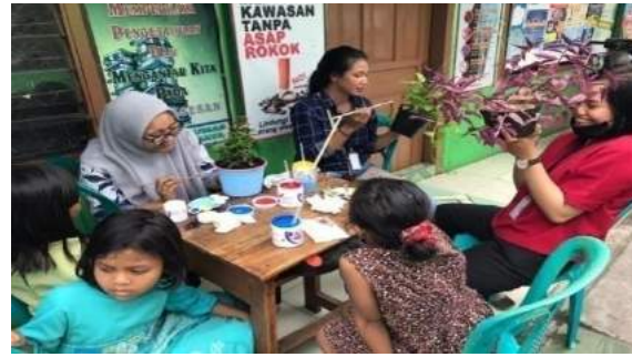
Gambar 23. Mahasiswa KKN melakukan pengecatan dan menghias pot yang sudah ada sebelumnya.