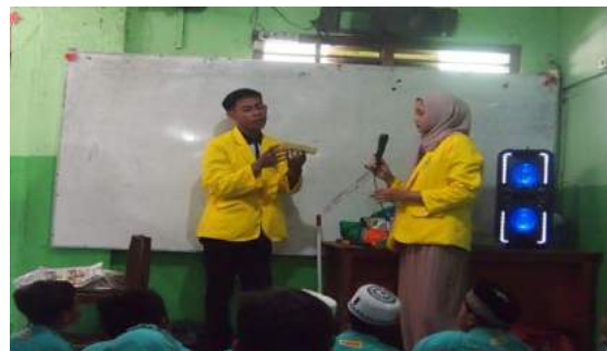
Gambar 19. Pendemoan tentang penanaman hidroponik dari pembibitan hingga dipindahkan ke botol.