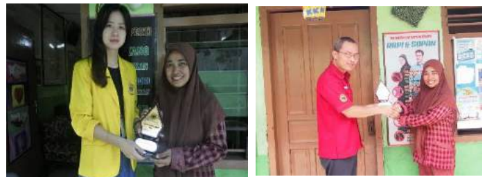
Gambar 38. Penyerahan fendel kepada pihak sekolah.