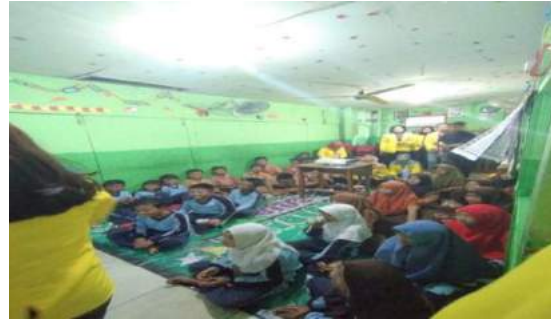
Gambar 13. Penyampaian materi tentang Hidroponik.