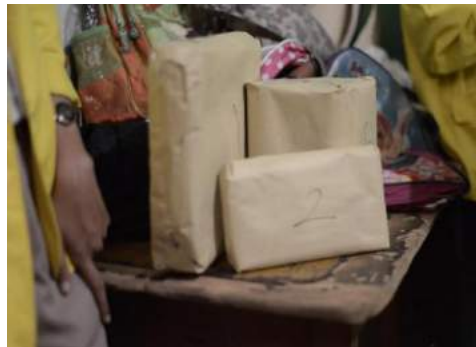
Gambar 36. Hadiah untuk masing – masing kelompok yang menjadi juara.