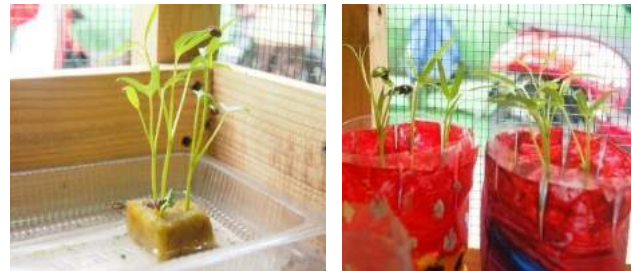
Gambar 27. Keadaan tanaman kangkung di minggu pertama.