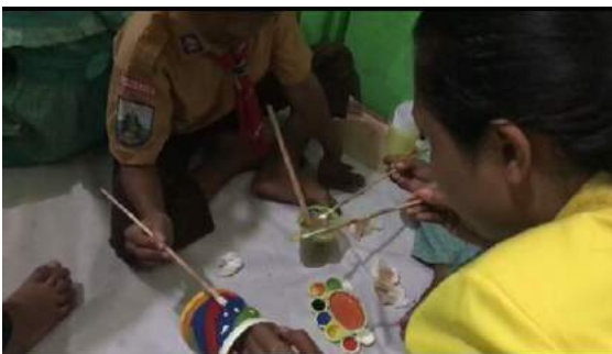
Gambar 18. Siswa melukis botol sesuai dengan kreasi mereka yang didampingi oleh mahasiswa KKN.