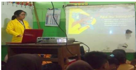
Gambar 5. Penyampaian materi tentang sampah kepada para siswa.