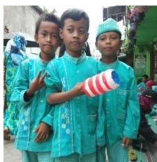
Gambar 9. Botol – botol yang telah dilukis para siswa.