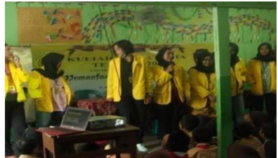
Gambar 2. Pengenalan mahasiswa KKN kepada siswa.