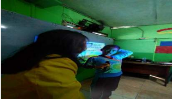
Gambar 12. Dimulai dari persiapan para siswa oleh mahasiswa KKN.