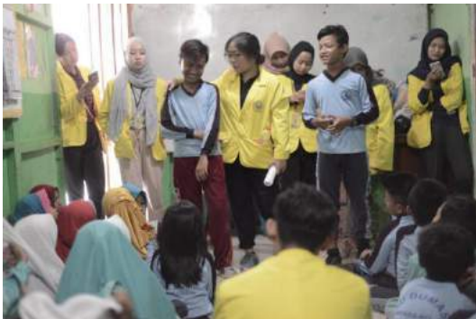
Gambar 35. Penyampaian pesan dan kesan para siswa kepada mahasiswa KKN.