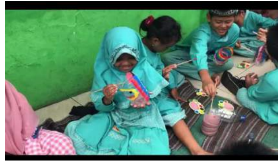
Gambar 8. Para siswa melukis botol untuk tanaman hias sesuai dengan kreasi mereka.