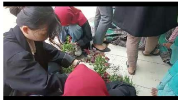
Gambar 10. Memindahkan tanaman hias ke pot botol plastic yang telah dihias di bantu oleh mahasiswa KKN