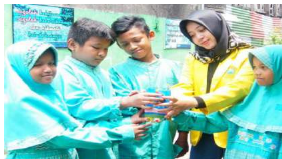
Gambar 21. Peletakan pot hidroponik kedalam rak hidroponik.