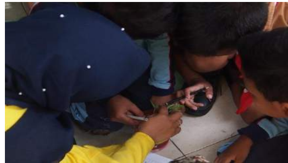
Gambar 25. Para siswa per kelompok melakukan kegiatan menghitung banyak daun yang sudah tumbuh di bantu mahasiswa KKN.