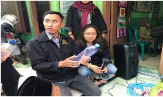
Gambar 7. Mendemokan cara membuat botol menjadi pot bunga kepada para siswa.