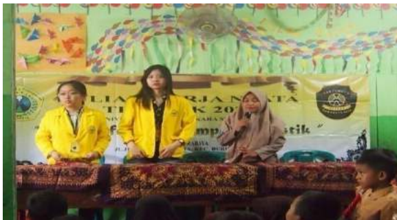
Gambar 3. Penyambutan kepala sekolah.