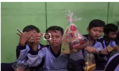
Gambar 37. Pemberian souvenir kepada para siswa.