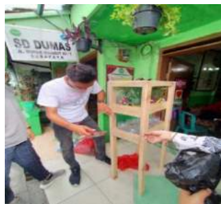
Gambar 11. Menata ulang pot – pot yang berada didepan kelas agar terlihat lebih rapi serta memasang jaring – jaring di rak untuk pot tanaman Hidroponik.